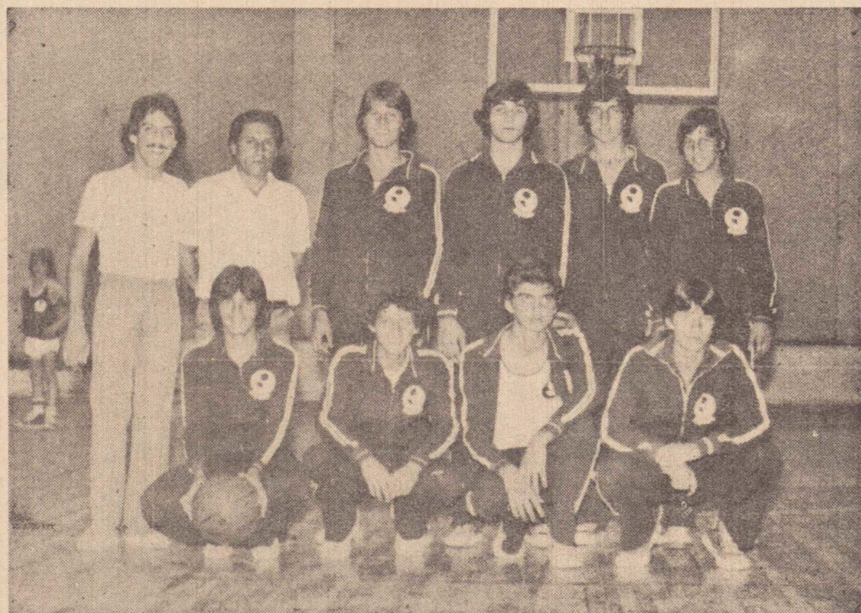
Equipe Infantil da S.E. Esquema, campeã da 1.a Copa Centro-Oeste de Basquete