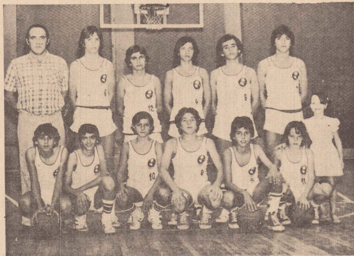
Equipe Mirim da Sociedade Esportiva Esquema, campeã da 1.a Copa Centro-Oeste de Basquete