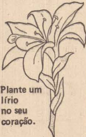
Plante um lírio no seu coração.

— Dia 22 de março teremos curso de batismo com início para as 14 hs.