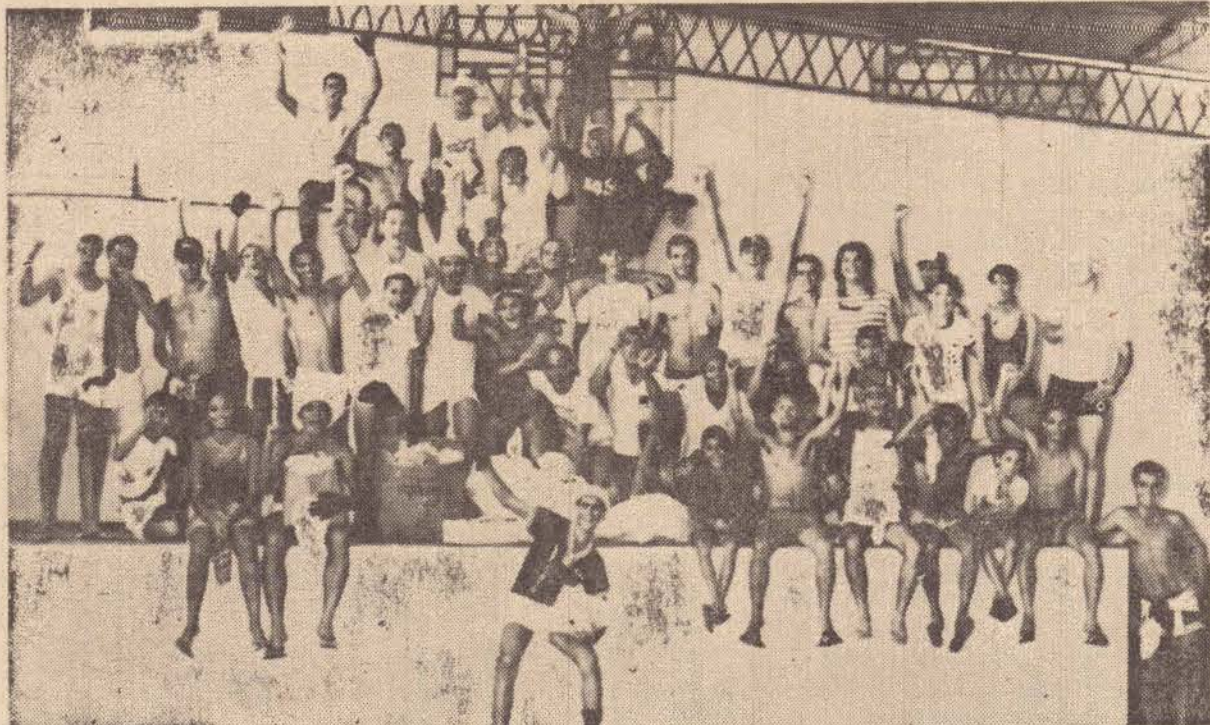
Calouros de engenharia contribuíram com gêneros alimentícios.