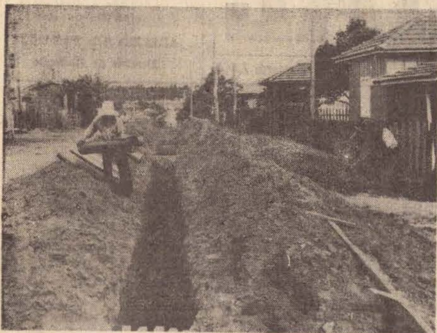
As ruas dos bairros recebem o melhoramento do DAE da municipalidade venceslauense.