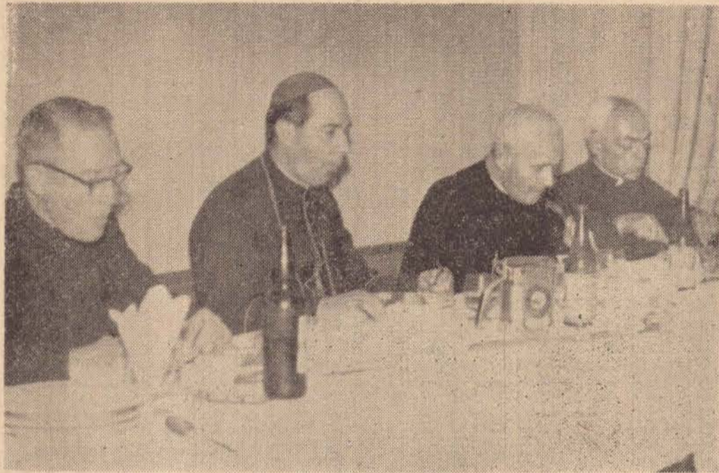
Flagrante do jantar de despedida, no Peretti Hotel, oferecido ao Bispo Diocesano, pelos sacerdotes da região.