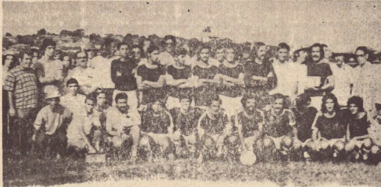
Na foto acima, vê-se o esquadrão da Faculdade de Economia que sagrou-se vencedor do campeonato amador da cidade, promovido pela Liga Prudentina de Futebol, vindo-se os heróis da batalha final, ladeados por dirigentes e aficionados aparecendo a equi peda Rádio Comercial e do Jornal "O IMPARCIAL".