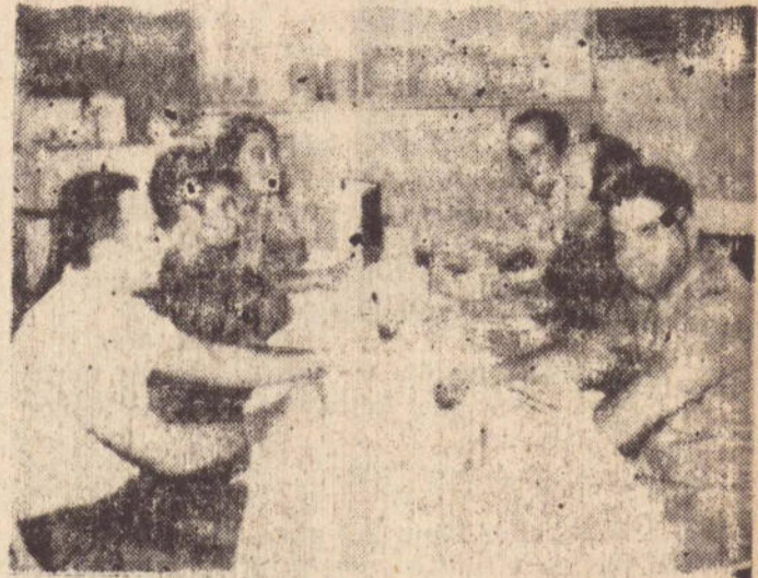
No clichê, um flagrante do jantar de confraternização oferecido pela Sanvas S.A.