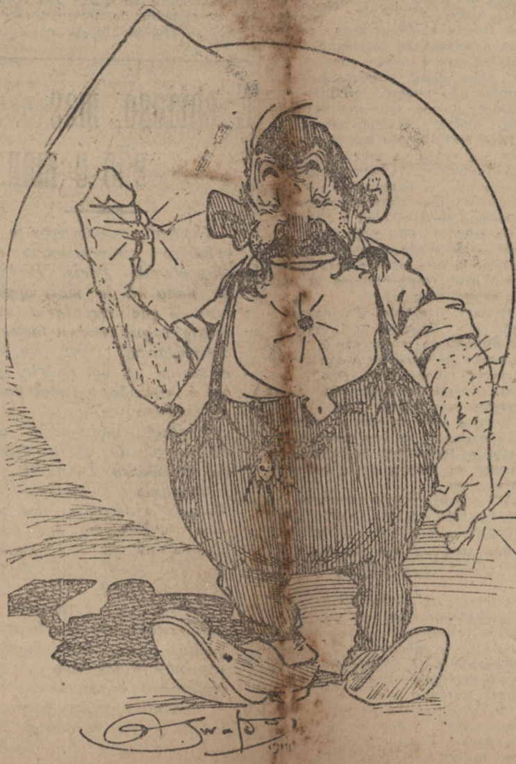
— Mau, mau! Se contiver esse berreiro contra a crise, a canalha ainda é capaz de se lembrar de mim.