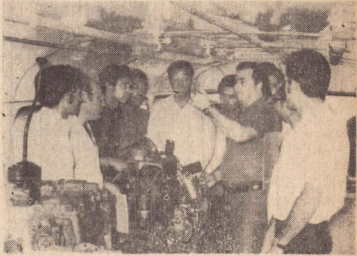
Mecanicos e Motoristas da BRASILIA sabem tudo sobre motores.

mecanicos como este que soal de Transportes Coletivo acaba de ser realizado em Brasilia S.A com excelente Pres. Prudente com o pes indice de aproveitamento.