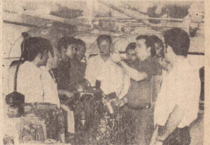
Mecanicos e Motoristas da BRASILIA sabem tudo sobre motores.

mecanicos como este que soal de Transportes Coletivo acaba de ser realizado em Brasilia S.A com excelente Pres. Prudente com o pes índice de aproveitamento.