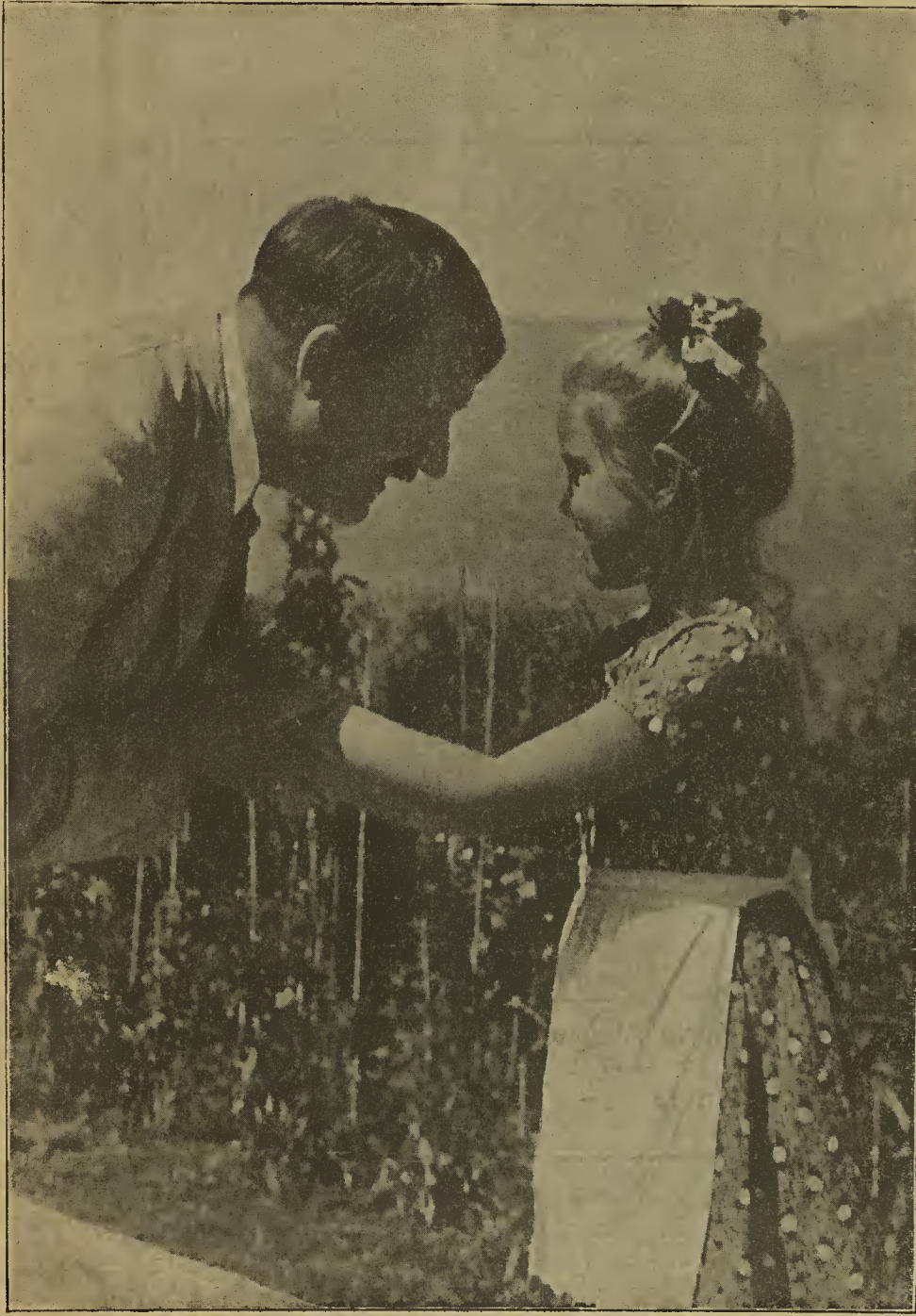
Ein Geburtstagsglückwunsch der Jugend

zählreichen bisher eingegangenen Bestellungen in der Reihenfolge des Eingangs zur Erledigung kommen, wie dies auch mit den noch einlaufenden Bestellungen geschehen wird. Aufträge sind