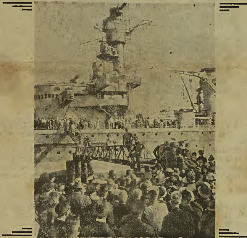
Alle wollen die „Deutschland“ sehen

Schon vergessen, daß nicht die „Volksdienste“ und Konfessionsparteien das organisierte Gottlosetum ausgerottet haben, sondern die NSDAP? Schon vergessen, daß mit der Machtübernahme Hitlers dem Sektenswafsen und der organisierten Kirchenaustrittsbewegung ein Ende bereitet wurde? Schon vergessen, daß Hitler der erste Staatsmann war, der es in seiner ersten Ansprache wieder wagte, den Segen des Allmächtigen für sein Werk zu erbitten? Schon vergessen, daß es der Führer war, der am 1. Februar 1933 erklärte: „Die Reichsregierung wird das Christentum als Basis unserer Gesamtmoral, die Familie als Keimzelle unseres Volkes und Staatskörpers in ihren festen Schutz nehmen“? Schon vergessen, daß erst seit Hitler den christlichen Kirchen die Möglichkeit rechtlicher Sicherung ihrer notwendigen materiellen Mittel gegeben wurde? Schon vergessen, daß schließlich im Verlauf der volksaufbauenden Politik des