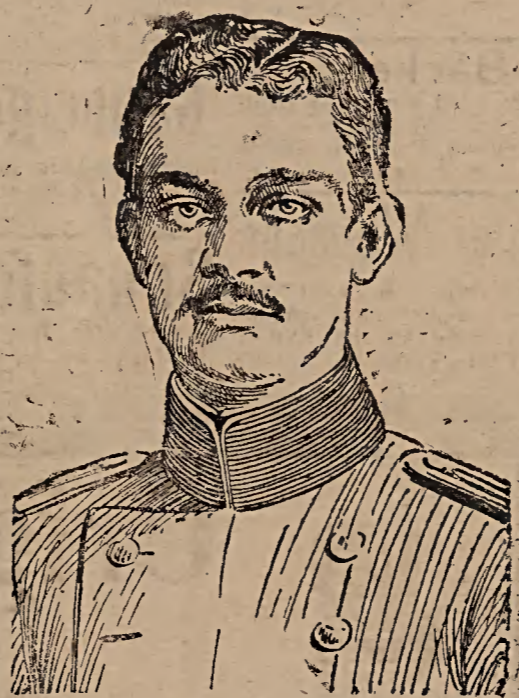
Prinz Ernst August von Cumberland.