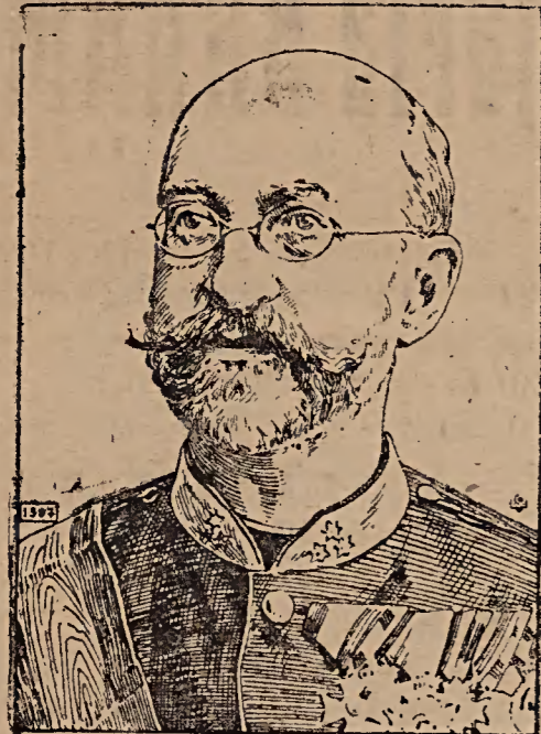
Herzog Ernst August von Cumberland, der Vater des Bräutigams der Prinzessin Viktoria Luise.