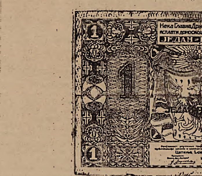
Montenegrinisches Kriegsgeld. Erlaubt Kaiser Franz Joseph nach Erledigung der bosnischen Frage dem König Nikola zwei Millionen Kronen als „Donner“ überwieht, die feierlich im Wiener Münzamt angefertigt wurden, ist der größte Teil dieses „Metallschubes“ im Wege des Grenzverkehrs in österreichische Rassen gewandert. Aber König Nikola hat sich stets zu helfen gewußt. „Modern“ heißt die Barock. Kurz vor Beginn des Krieges wurde eine Prager Druckerei beauftragt, montenegrinische Banknoten herzustellen. Sie hat diese Aufgabe recht gut gelöst. Interessant ist, daß der Wert eines solchen „Blauen“ ganze 70 Pfennig beträgt, und daß in der rechten unteren Ecke die Firma der Druckerei — Unic Prague — ersichtlich gemacht ist.

sagen; denn die Modeentwürfe für den Winter sind längst vorher festgestellt, und die Bestellungen hätten längst vorher gemacht sein können, ohne daß die Damen zu befürchten brauchen, von ihren Rivalinnen übertrumpft zu werden. Gedankenlos, keineswegs böseartig sind oft auch jene, die kurz vor einem Fest zu ihrer Schneiderin oder Modistin gelaufen kommen und sie um umgehende Lieferung der kompliziertesten Robe angehen. Erklärt die Schneiderin, es ginge unmöglich noch einzurichten, so wird zuerst in den süßesten Tönen geflüstert: „Aber liebste Fräulein, Sie werden mich doch nicht im Stich lassen wollen; denken Sie doch nur, dieses Fest, Graf X soll mich zu Tisch führen.“ Hilft das nicht, dann wird man kühler, läßt durchblicken, daß es ja auch noch andere erstklassige Schneiderinnen gäbe usw., bis dann schließlich die verängstigte Modekünstlerin alles verspricht, was von ihr verlangt wird. Und dann ist die Reihe an den Arbeiterinnen, die Unüberlegtheit der Damen ihrerseits abzubüßen. Ueberstunden müssen gemacht, die Arbeit muß wohl gar noch abends ins Haus mitgenommen, der Sonntag oft mit geopfert werden. Allem dem kann man eben nur die Selbsterziehung des Publikums abhelfen; denn mit Zwang und Gesetzesverordnungen ist wenig zu erreichen, solange es Geschäftsleute gibt, die ihren Kunden zu Liebe und um den Mitbewerb zu überflügeln, ihren Angestellten alles zuzunuten, und solange es soziale Klassen gibt, die zu allem greifen müssen, was ihnen ge-