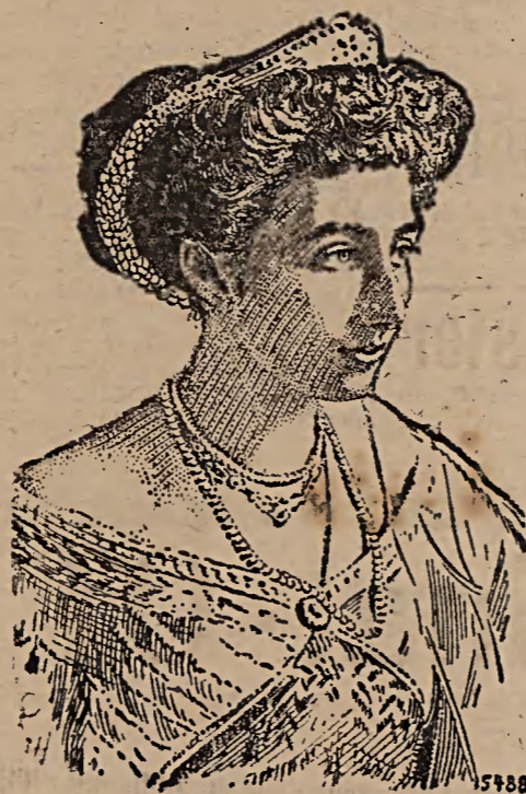
Prinzessin Viktoria Luise.