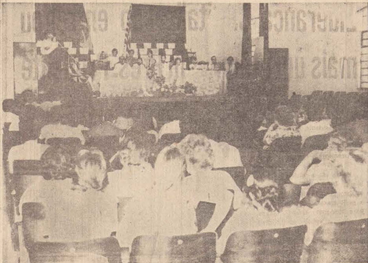
O I Fórum de Educação foi realizado no anfiteatro da Instituição Toledo de Ensino, com grande frequência

Não. Um homem apenas e vagamente distanciado das coisas superfúas desta vida. E profundamente devotado a sua obra. Eis tudo.