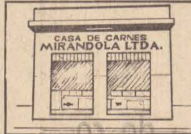
CASA DE CARNES MIRANDOLA Av. Ana Jacinta, 2228 Centro Comercial da Cecap