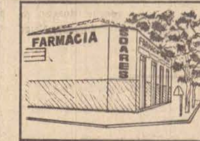
FARMÁCIA SOARES Rua Pedro de Toledo, 401 esquina c/ Nações Unidas Fone: 33-4030