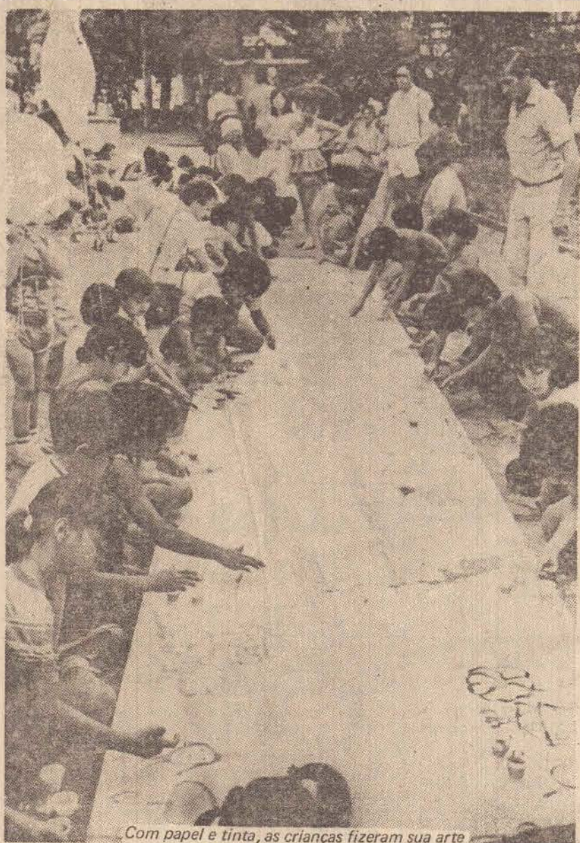
Com papel e tinta, as crianças fizeram sua arte

Para essas provas estão inscritos 140 cavaleiros, de São Paulo, Mato Grosso do Sul e Paraná, entre crianças e adultos, transformando o I Campeonato Regional Anual de Cavalos de Trabalho, no maior torneio do gênero já realizado no País.