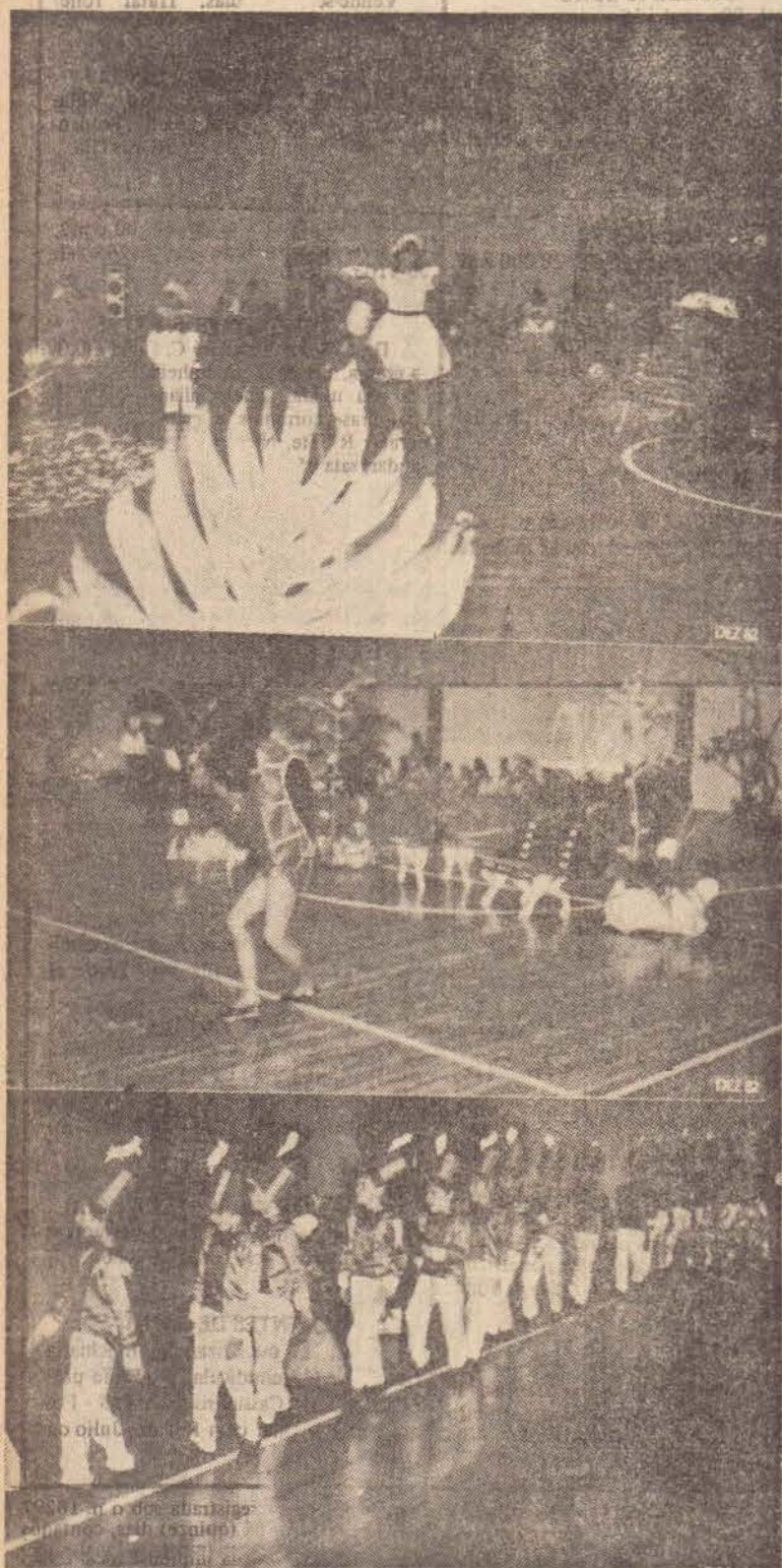
As crianças mostram a primeira apresentação da peça, no próprio Ginásio da Apea, em dezembro do ano passado

Dentro da programação da Semana da Criança e do mês de aniversário da Prudentina, os alunos do Esqueminha apresentarão hoje, às 19h30, a peça musical infantil "O Sonho de Alice". Esse musical foi sucesso no Rio de Janeiro durante muitos meses e cumpre agora temporada de igual sucesso em São Paulo. A peça de músicas de Roberto e Erasmo Carlos, tendo no papel principal Miryam Rios. A história se passa num jardim, onde Alice brinca com sua gatinha. Adormece e