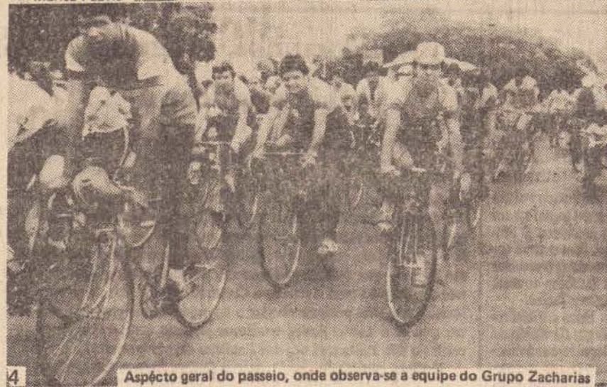
4 Aspecto geral do passeio, onde observa-se a equipe do Grupo Zacharias

Milhares de crianças, jovens e adultos participaram do I Passeio Ciclístico Comunitário de Presidente Prudente. O evento que aconteceu na manhã do feriado de Nossa Senhora Aparecida teve a promoção da BRASIMAC/CALOI, com o apoio da Coordenadoria de Educação, Cultura e Turismo do Município, Autarquia Municipal de Esportes, Escola Senai, Instituto Municipal de Ensino Superior (Imespp), Refrigerante Rio Preto S/A - fabricante autorizado Coca-Cola, Jornal O IMPARCIAL e Rádio Comercial AM/FM.