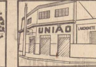
PANIFICADORA LANCHONETE E PIZZARIA UNIÃO Rua Quintino Bocaiuva, 977 Fone: 33-5734