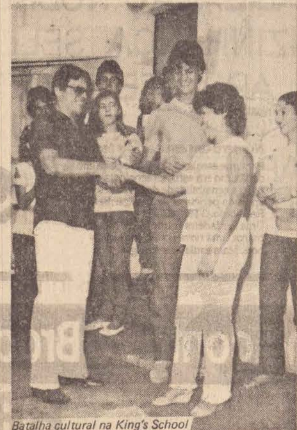
Batalha cultural na King's School