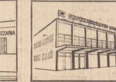
SUPERMERCADO CASA MOREIRA Rua Nestor Seabra, 355 - Jd. Paulista esquina com a Rua Fernão Dias

área essa que se acha devidamente registrada sob o n. 18297 neste cartório. Fim do prazo de 15 (quinze) dias, contados da data da última publicação deste na imprensa local e não havendo impugnação por parte de terceiros, será feita a inscrição do mencionado loteamento, nos termos da lei 6.766, de 19 de dezembro de 1979. Dado e passado nesta cidade e comarca de Presidente Prudente, no Segundo Cartório de Registro de Imóveis e Anexos, aos 12, digo, aos 13 (treze) dias do mês de outubro de 1983 (hum mil, novecentos e oitenta e três). Eu Oficial do registro que subscrevi.