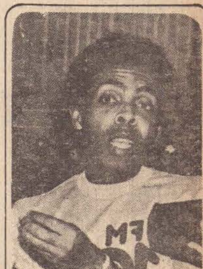
Gil: "Funk-se quem puder"

IMPOSTOS SEM ACRÉSCIMOS O mesmo vereador sugeriu também ao prefeito verificar a possibilidade de enviar à Câmara projeto de lei, concedendo aos contribuintes devedores de impostos municipais, o benefício de pagá-los sem os acréscimos de juros e correção monetária, a partir da data da vigência da lei até 31 de dezembro de 1983. A medida - justificou - visa facilitar os contribuintes que por falta de recursos financeiros ainda não tiveram condições de pagar os seus impostos e por outro lado, melhorar a arrecadação no fim do exercício.