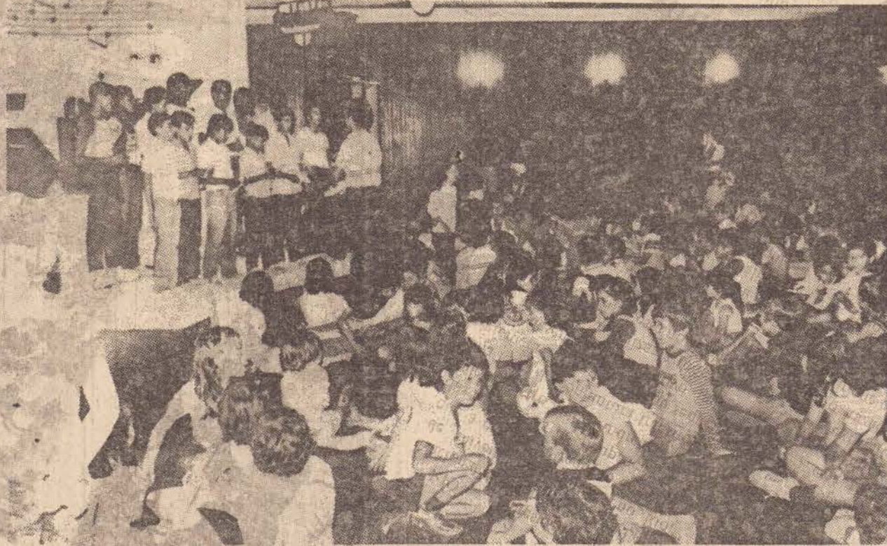
O Coral de Jornalheiros de "O Imparcial" fez sua segunda apresentação em público e foi bastante aplaudido.

Para hoje, a programação prevê apresentação da peça infantil "Sonho de Alice", pelos alunos do Esqueminha. (Mais informações sobre a programação de hoje, na página 10).