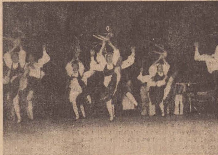
O Grupo Folclórico Italiano, com 80 figuras