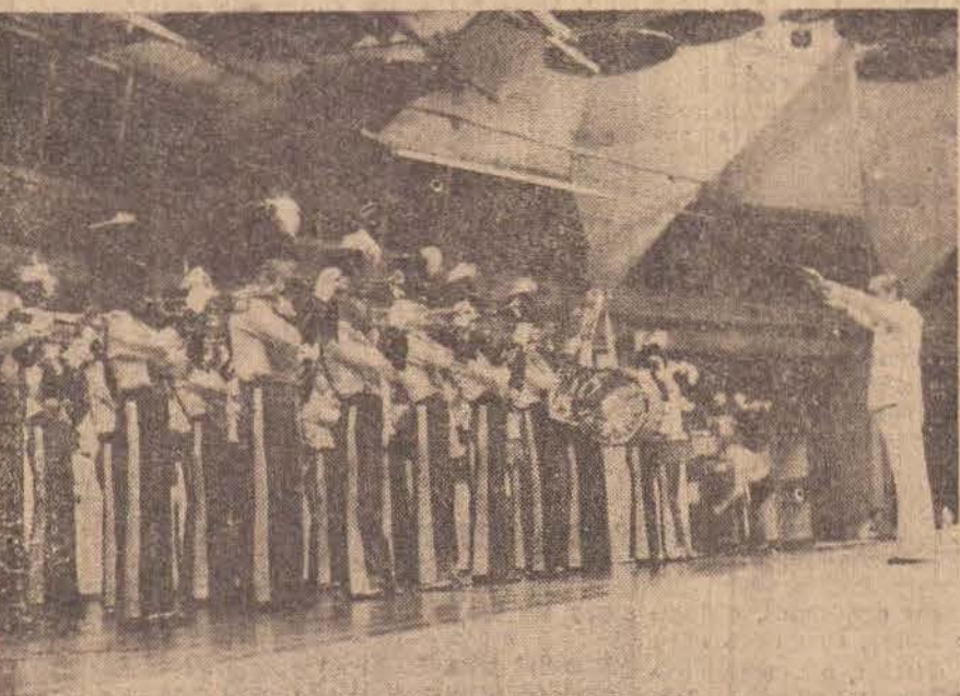
A Banda Marcial do Senac, com 63 figurantes