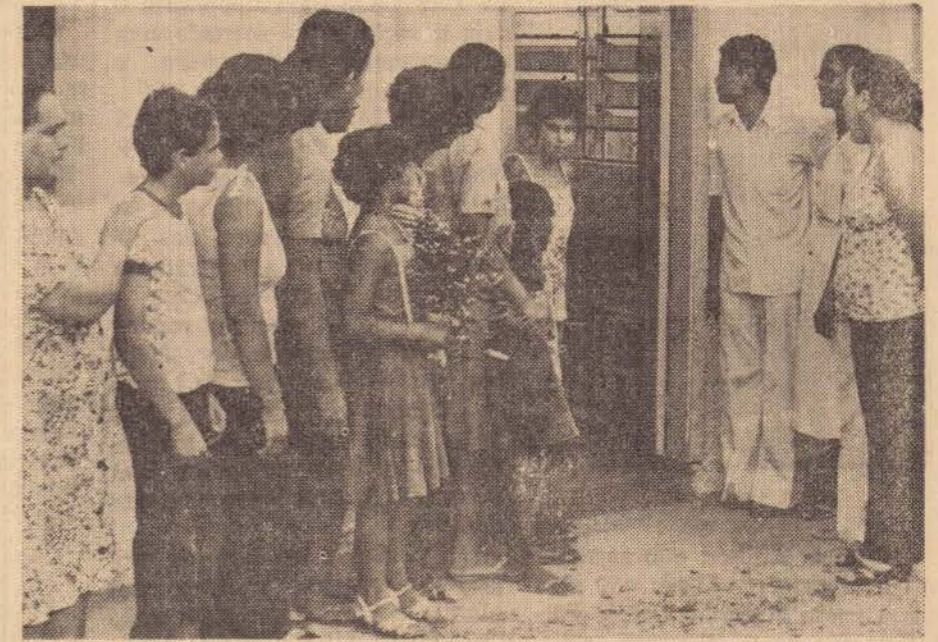
A dolorosa espera à porta dos necrotérios. A morte já ocorreu há 40 horas e o corpo não foi entregue ainda à família.

A situação acaba ficando difícil para os estabelecimentos hospitalares, para os enfermeiros e até com os investigadores de poli-