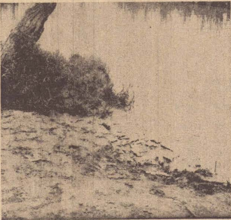
Os peixes mortos foram encontrados às margens do rio.