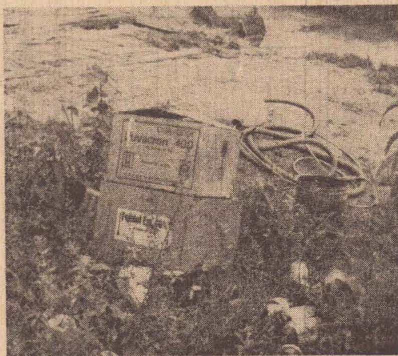
Resíduos de defensivos agrícolas foram a causa da mortandade.

A fotografia acima retrata bem como vivem os ocupantes das ilhas nesses momentos, acostumados ao fenômeno das cheias no rio.