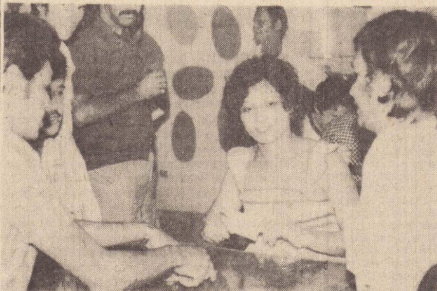
Uma linda senhora (formando dupla) quando estava jogando sua partida, mostrando muita classe e muita técnica segundo os que lá compareceram.