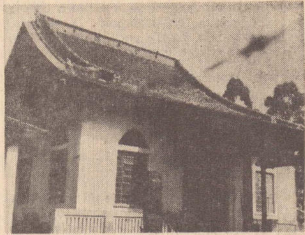
O templo nos dias de hoje