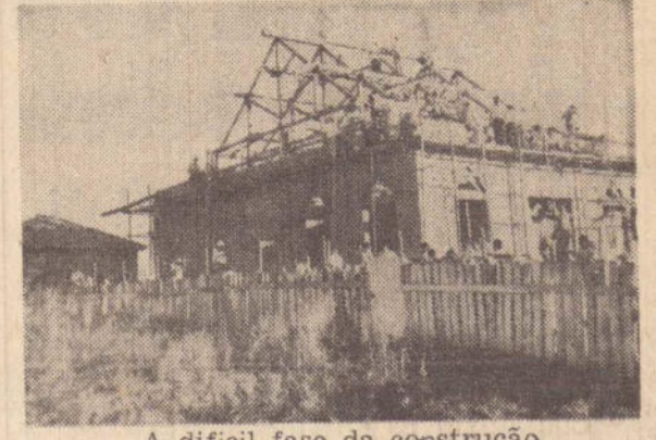
A difícil fase da construção

Nós estamos vinculados pela confiança recíproca, pela confiança que tenho neste povo que trabalha, e creio na confiança que este mesmo povo deposita na ação do governo. Acima das malquerências, acima do derrotismo, acima daqueles que nos denigrem, vosso prefeito, em poucas palavras, lembrou as obras da revolução. Elas constituem, sem dúvida um galardão em nosso trabalho. Do meu trabalho e dos meus antecessores. Outros empreendimentos virão sem dúvida, no futuro, mas há ainda muito por fazer. Mas, para isso; é necessário, é indispensável que continuemos unidos, que saibamos distinguir quais são os nossos adversários, saibamos nos colocar acima deles e, pelo nosso exemplo, pelo nosso trabalho, fazemos de fato o Brasil que queremos".