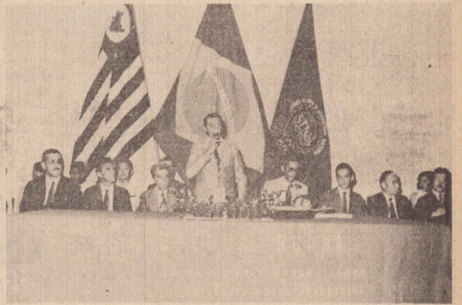
Flagrante da solenidade de entrega de certificados à 20.ª Turma de Aprendizes da Escola SENAI.