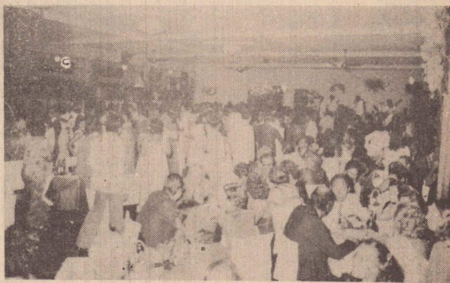
Uma cena mostrando a verdadeira multidão presente no Tennis Clube, no seu "reveillon", um dos melhores do interior.