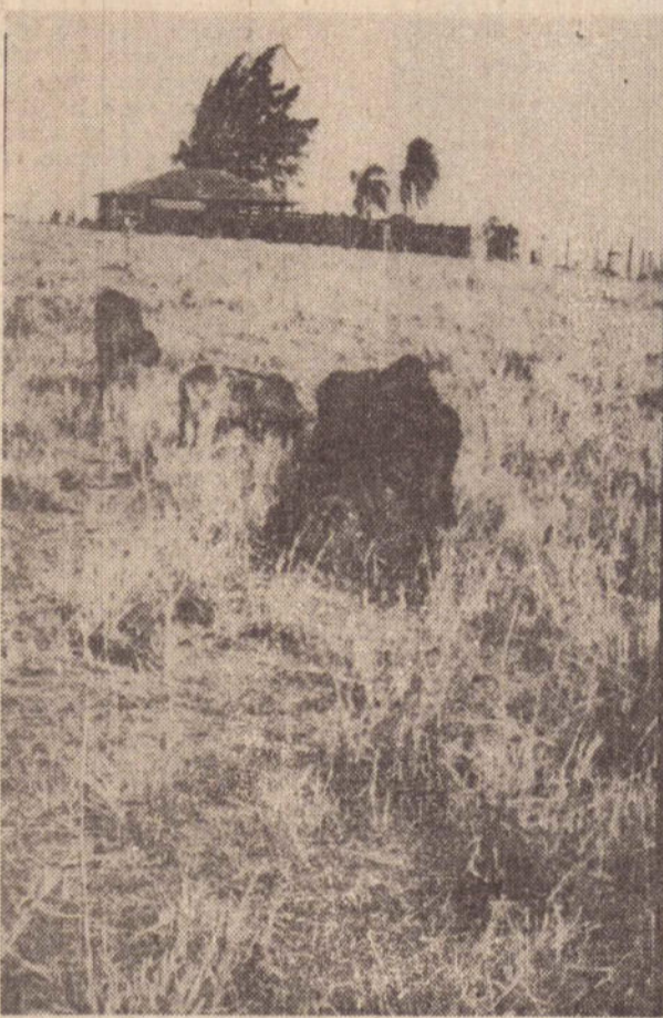
A "cigarrinha" deixa os pastos ressequidos e o gado emagrece.

Depois disto a Dira colocará a disposição de cada um, certa quantidade de fungos destinada a reprodução. No próximo ciclo ativo da "cigarrinha" que pode desaparecer dentro de 30 dias segundo as previsões, cada proprietário terá material suficiente para jogar nos pastos e evitar