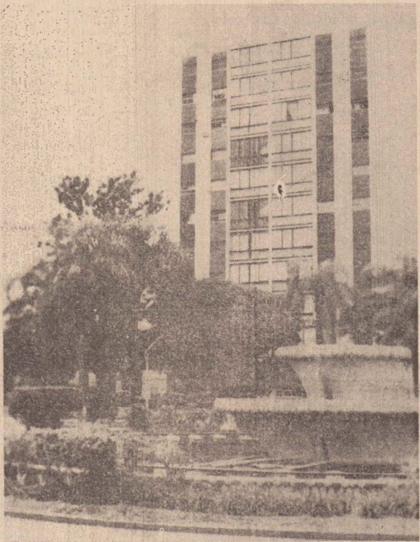
A Fonte cinquentenária foi esquecida e se deteriora