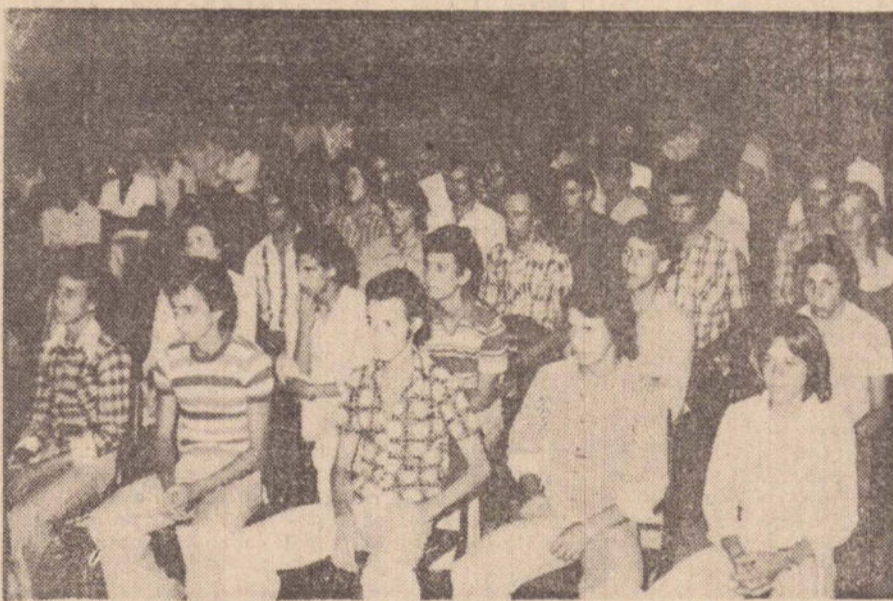
Os novos jovens aprendizes que receberam certificado de conclusão do concurso ministrado pelo SENAI.