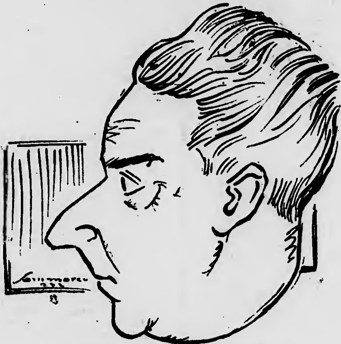
Il cavaliere direttore e conquistatore.