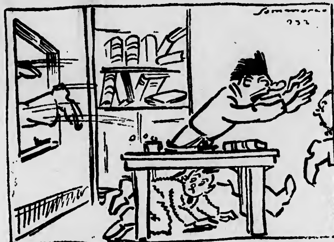
il rombo di un... traio, giunge inaspettato.