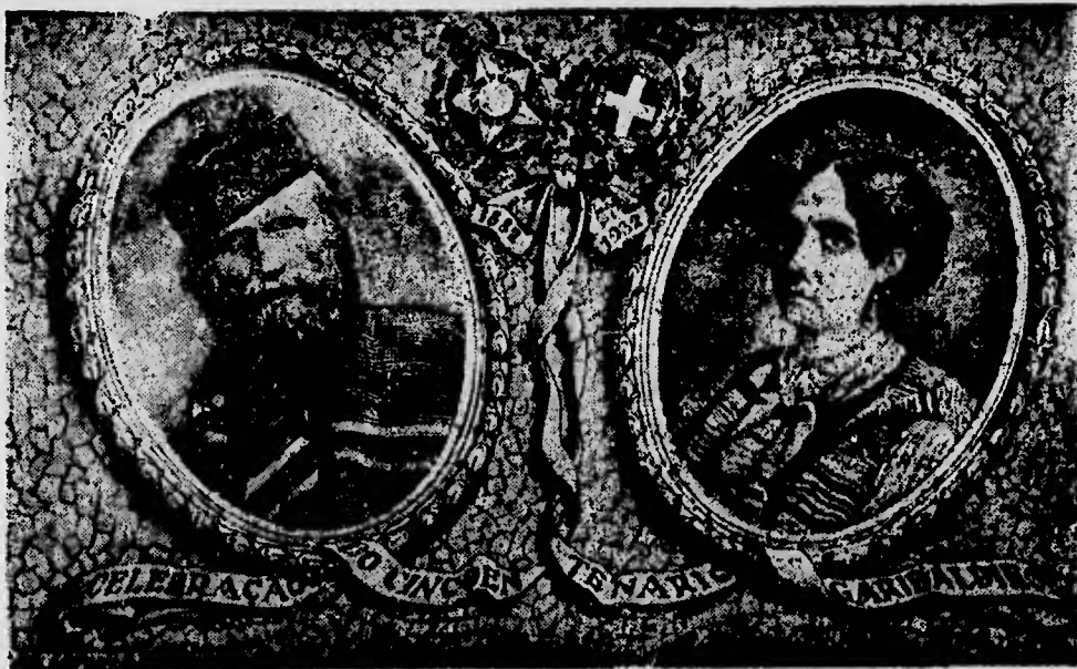
Riproduzione della cartolina artistica, edita dalla "Papeleria S. José" — Rua da Gloria, 22 — in commemorazione del cinquantenario garibaldino.