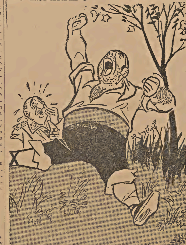
El Gigante Despierta

Sin embargo, a pesar de los hechos luctuosos, ocasionados por estos acontecimientos, es de admirar la actitud solidaria de los estudiantes a favor del proletariado ametrallado y de los huelguistas. Este binomio obrero-estudiantil, unido frente al cesarismo militarista, es un indicio de la madurez que va adquiriendo el movimiento