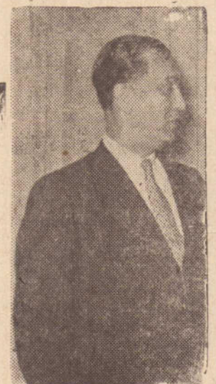
Brasília, 6 (SSI) — Fontes credenciadas revelaram nesta cidade

de que a Procuradoria Geral da República decidiu dar entrada, amanhã, quarta-feira, S.T.F., de um parecer pedindo sequestro de alguns bens do ex-presidente Juscelino.