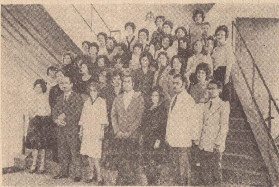
Nesta foto, conseguimos reunir todos os professores e dirigentes do GESC "Dr. João Franco de Godoy".