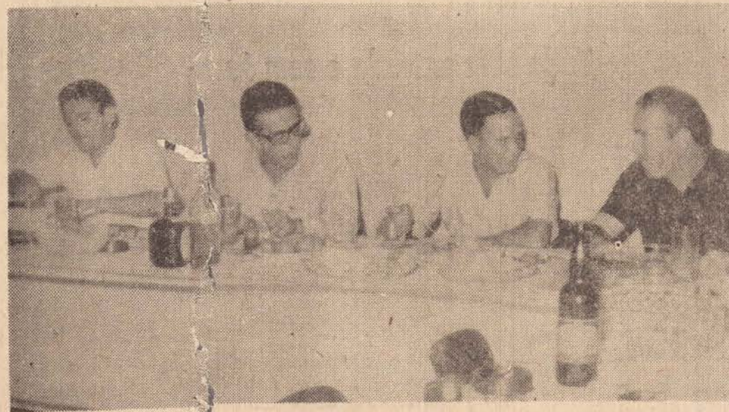
O clichê acima fixa um aspecto do jantar de confraternização que reuniu os gerentes de Pres. Prudente, São Paulo, Nova Andradina, Presidente Epitácio, Alfredo Marcondes, São José do Rio Preto, Araçatuba e Campo Grande.