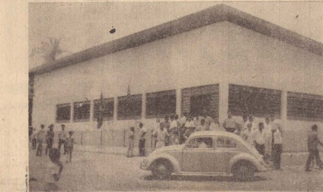
A inauguração do Clube Operário constituiu um dos pontos de grande interesse na programação do aniversário de Martinópolis.