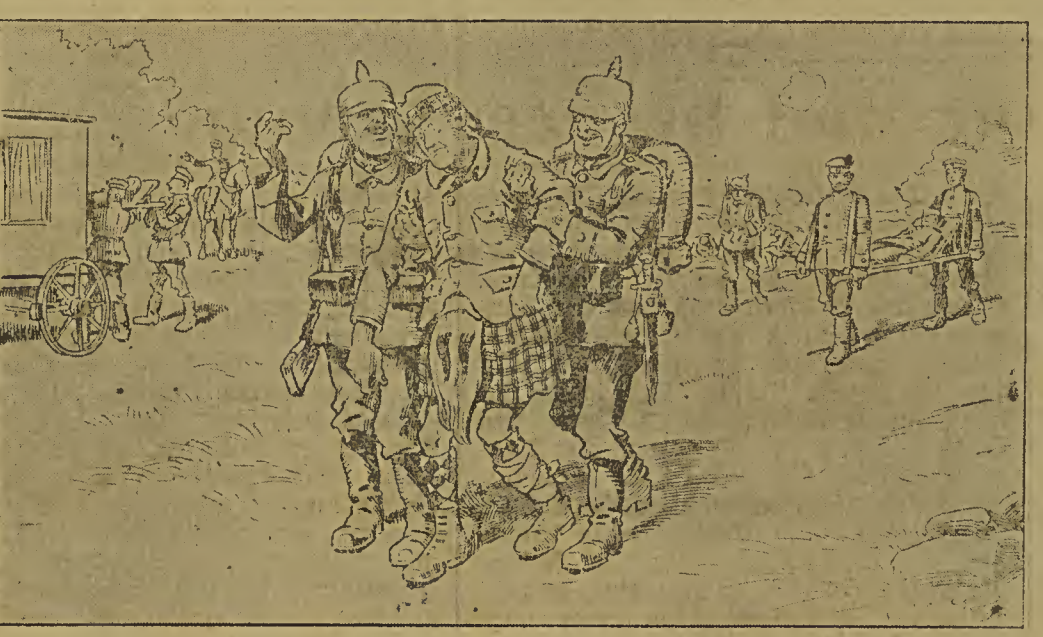
„Na, du moanst gewiss, du mnasst nach Rupprechtsburg, z'wegen der besonderen Vergeltung? Na, dös gib's nit, — bei uns Bayern kriagst du Weisswirscht un a Bier, un dō Hax'n mach'n wie dir an wieda g'sund!“

Spinnereien, die über 5000 Menschen beschäftigten, wurden in Grund und Boden geschossen. „Und das alles haben die Franzosen getan!“ rief ein zum Bettler gewordener Familienvater aus. Er verheißt nicht, daß von den französischen Soldaten keine Rücksicht auf das Privateigentum genommen wird. Es gibt keine Requisitionen, kein Bargeld; sie führen das Vieh aus den Ställen, holen aus den Kellern, was zu holen ist. Verlangt man eine Entschädigung, so wird entweder auf den Offizier verwiesen, der bezahlen soll (der Offizier bezahlt aber nicht), oder es heißt, die Lebensmittel müßten fortgeschafft werden, damit den Deutschen nichts Gemießbares in die Hände falle. Das Elend der gänzlich ausgeplünderten Menschen ist unsagbar. Sie leben