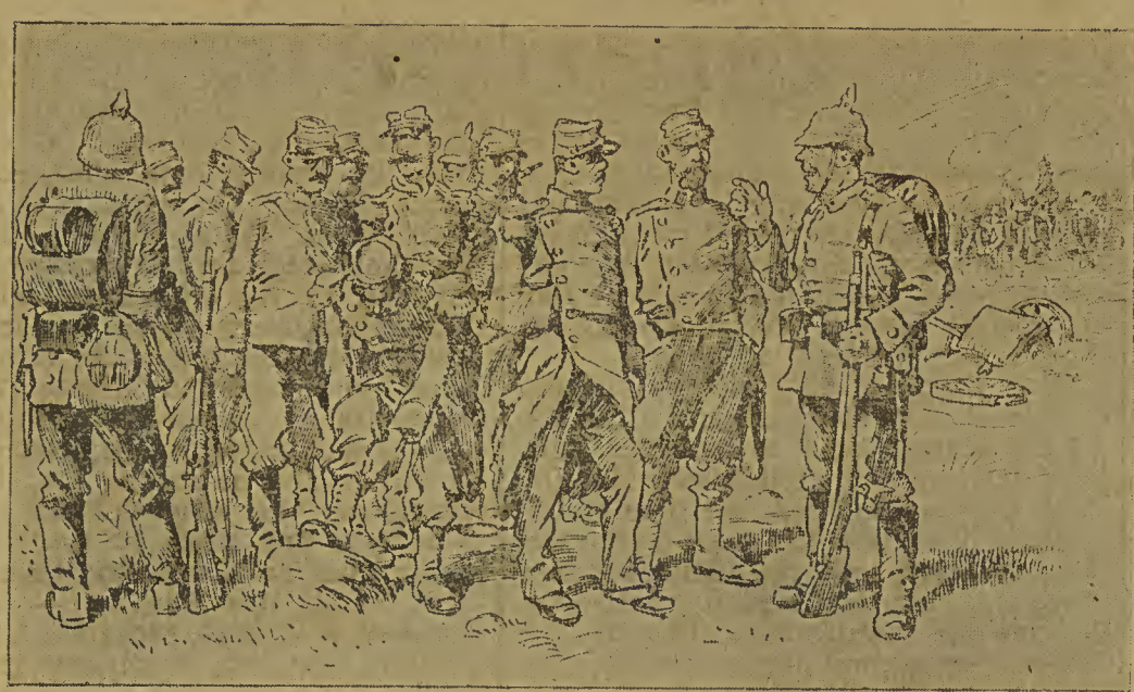
„Es dhud mer leed, dass ich Se gefang'n nehmen muss, — aber 's gehd nich andersch; gomm'n Se mir mid, in Sachsen gib's ooch Gaffee un Kuchen!“