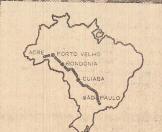
Antecipando-se à conclusão da BR-29, a caravana Ford percorreu todo o seu leito-piloto, travando contato direto com as gigantescas dificuldades com que se defronta a heróica engenharia brasileira, na conquista da selva.

Ford passa sempre! São Paulo—Acre: 4.150 km de desafios. Quase a metade do percurso por caminhos primitivos, abertos no chapadão mato-grossense e na floresta amazônica. Obstáculos sem conta: atoleiros, areões, picadas, pedras, troncos, rios e pinguelas. Nada conseguiu deter a caravana de caminhões Ford. Porque para o Ford não há caminhos difíceis. Ford passa sempre.