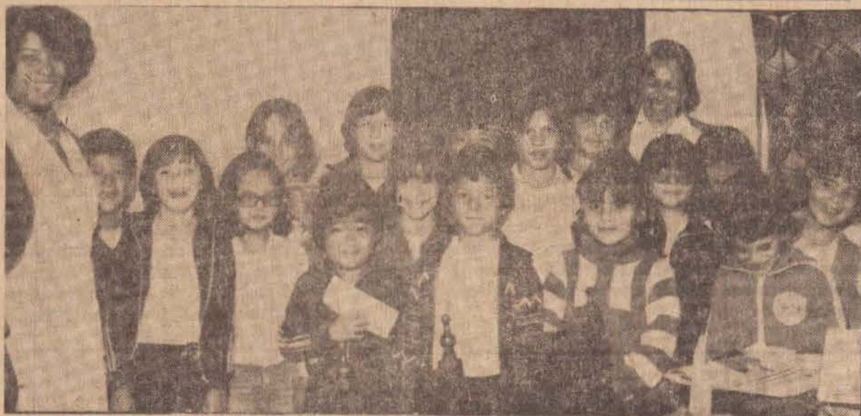
Os alunos do Esqueminha ontem cedo em nossa redação.

Após quatro anos de inatividade volta ao cenário futebolístico a Associação Atlética devendo jogar no próximo domingo dia 16 em Ribeirão dos Índios pelo campeonato amador regional e dia 23, nesta cidade. O "Gatão Teodoroense" espera a presença da torcida para reviver a fase aurea de 1974. Domingo no estádio da Associação, às 14 horas, infantil, Centro Social contra Nova Andradina de Mato Grosso Sul e na partida principal juvenil, Sacy F.C. e Juvenil de Nova Andradina.