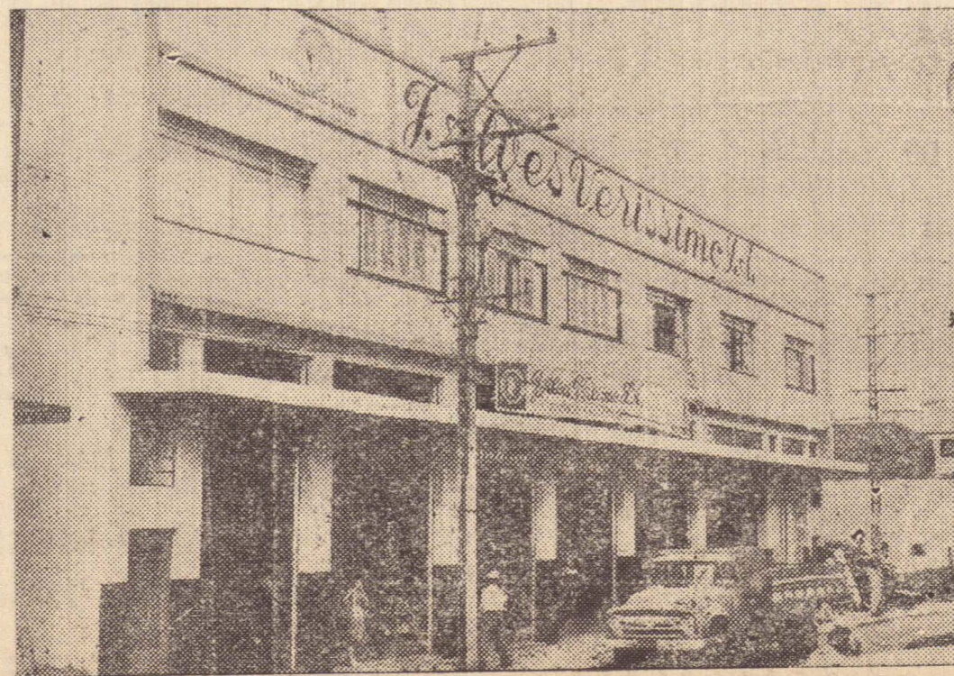
«Vista das modernas instalações da loja de varejos da firma J. Alves Verissimo S.A.»