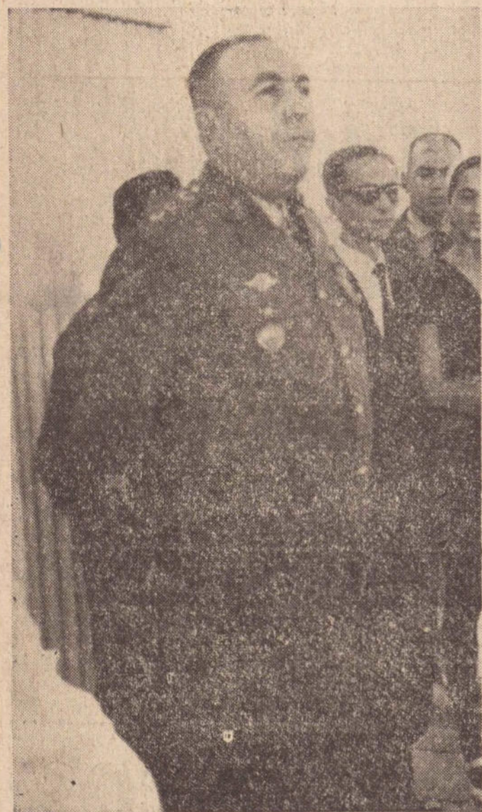
Cel. Confúncio: «A Polícia Militar de São Paulo é o orgulho do Brasil».