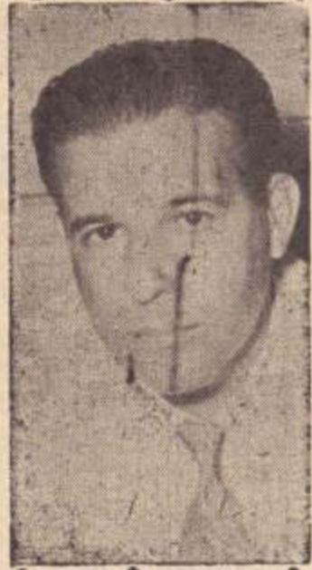
"O Presidente João Goulart presidirá a sessão de encerramento do Congresso Nacional dos Municípios".

Iniciou-se hoje na capital paranaense, o VI Congresso Nacional dos Municípios, que será encerrado a 23 do corrente, sob a presidência do Sr. João Goulart. Durante o conclave será debatido o temário cuja pauta é a seguinte: Planejamento e Urbanismo, Administração Financeira, Desenvolvimento Econômico e Social; SENAN; a Casa dos Municípios; Municipalização da Distribuição de Energia Elétrica; Divisão Administrativa e Territorial; Imposto Territorial Rural e suas implicações no Desenvolvimento Municipal.