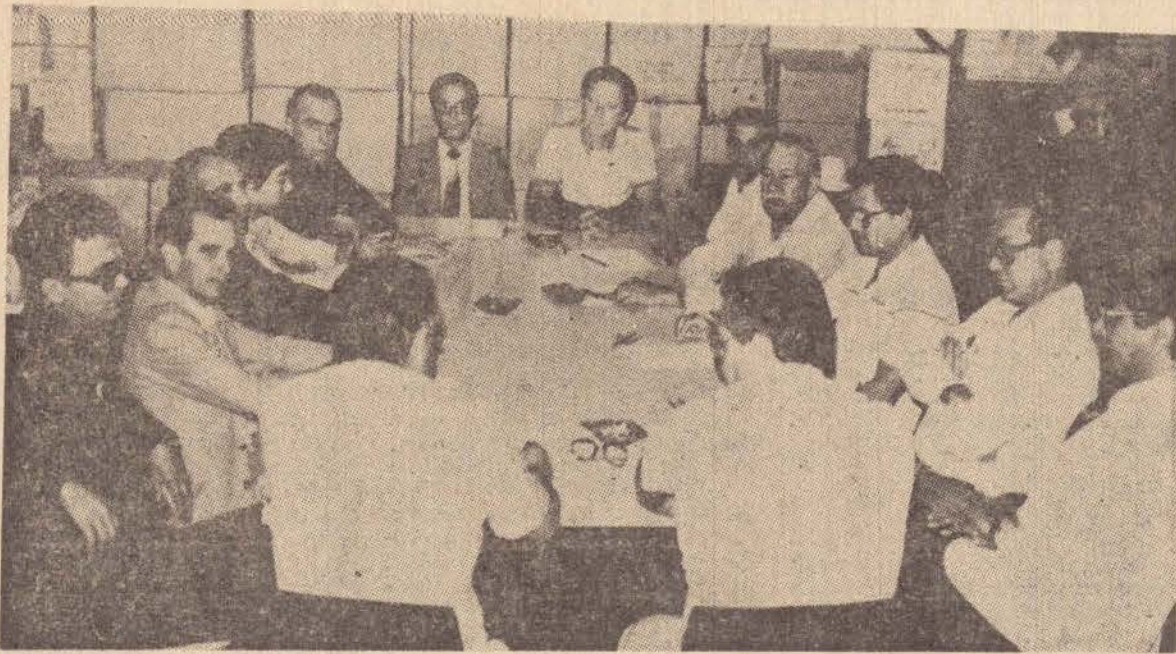
Os agentes da Receita da Região e chefes de Divisão da Delegacia participaram da reunião com o superintendente.