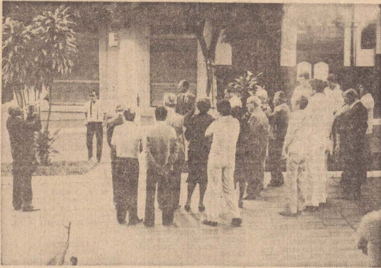
A solenidade aconteceu no obelisco.