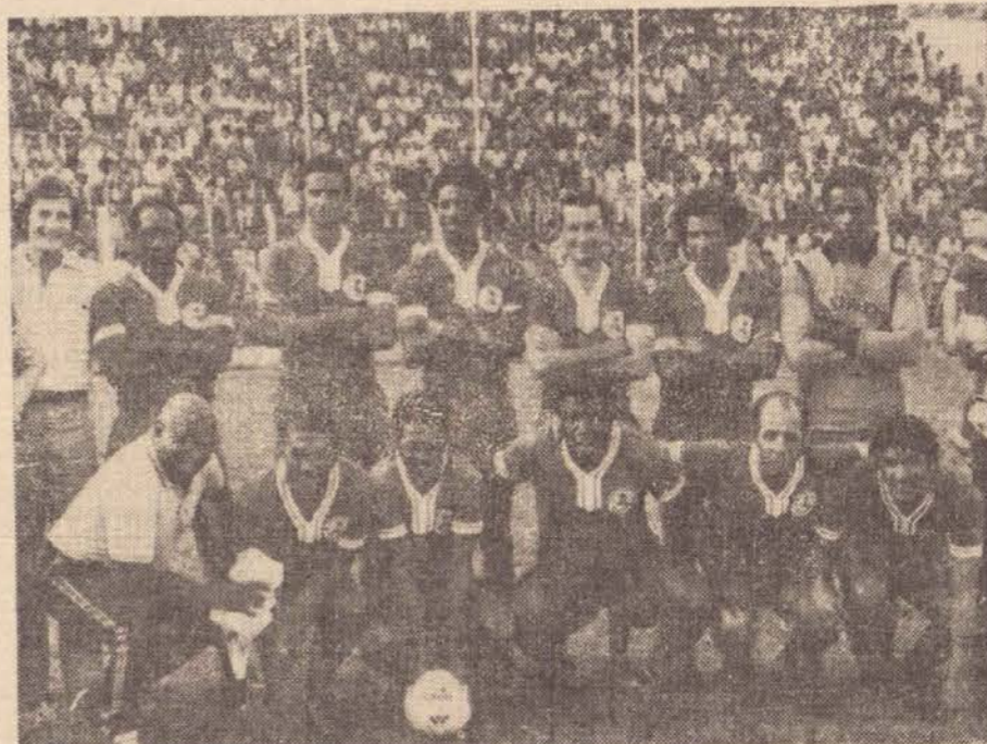
Equipe do Milionários, que hoje se apresenta em Bernardes

A Associação Atletica Bernardense, que juntamente com a Caixa Economica Estadual, está promovendo a Campanha do Agasalho naquela cidade, estará realizando com a intenção de angariar fundos para a campanha, uma sensacional partida de futebol no Estádio Arthur Ramos.