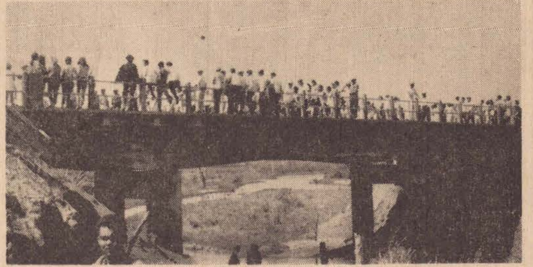
O acontecimento despertou vivo interesse entre os moradores da região. Logo após a inauguração a ponte foi aberta ao trânsito.