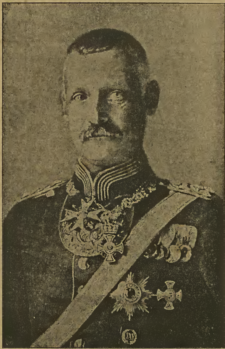
Kronprinz Rupprecht von Bayern, der Sieger von Metz.

Schließens, die darin gipfelt, einen Angreifer nicht wieder entschlippen zu lassen, bis der Verteidiger — unsere Ostarmee — aus der Defensive zum Angriff übergegangen ist und mit beiden Flügeln weit ausholend den Gegner umklammern kann. Ueber Gloggnitz und Neidenburg griff der rechte Flügel der Ostpreußen herauf und über Bischofsburg und Plessenheim der linke Flügel. So wurden drei Fronten dem Gegner versperrt, und die letzte Richtung, auf die Grenze zu, blieb ihm nur noch in schmalen Bahnen.