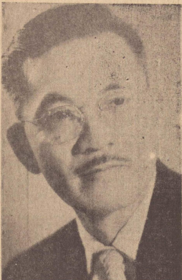
Sr. Hirai o homenageado da próxima terça-feira na Associação Comercial e Industrial de Pres Prudente