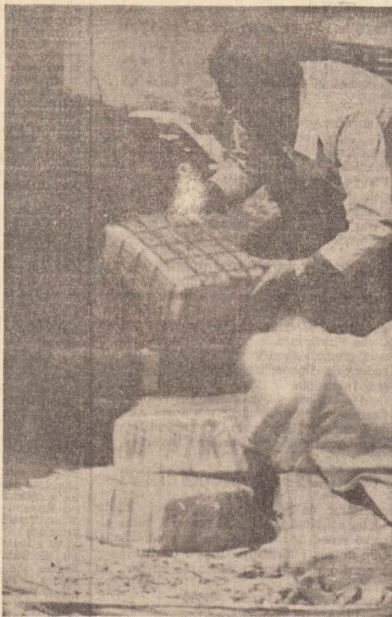
Foram atirados ao forno a mil graus de temperatura 150 "tijolos" de maconha prensada

Desde a apreensão, a maconha estava guardada na delegacia da DPF, e começou a ser mais vigiada depois que foi roubado do aeroporto um dos aviões envolvidos. Assim, ontem houve um forte aparato policial acompanhando a operação de transporte da maconha da DPF ao forno da cerâmica, com a participação de policiais fortemente armados. A maconha, foi transportada num caminhão tipo boiadeiro e tudo transcorreu normalmente, até que só sobram cinzas daquilo que se não tivesse sido apreendido, conforme bem o definiu o Juiz de Direito Vicen-