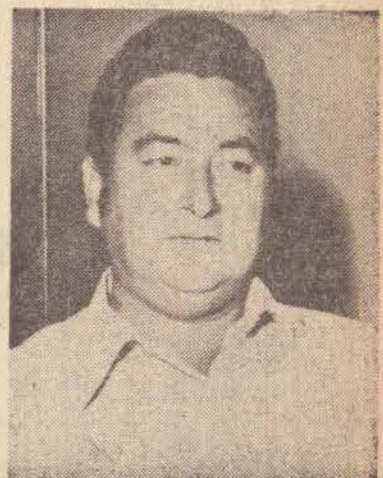
O prefeito de Taciba, pediu novamente ao Governador

Outros interessados são os produtores do Mato Grosso do Sul, pois consideram que esta estrada os beneficiará como corredor de exportação para