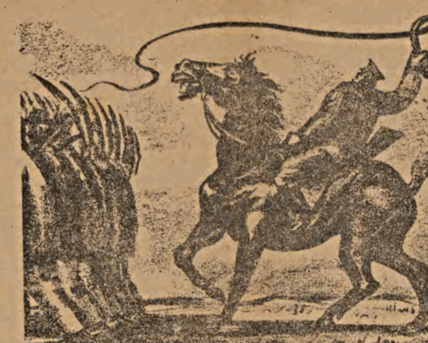
Van en cuadrillas, herramienta al hombro, como forzados, bajo la vigilancia y la instigación de los sicarios de Stalin...

Arrancar todas las víctimas a todas las tiranías. Ese es nuestro deber.