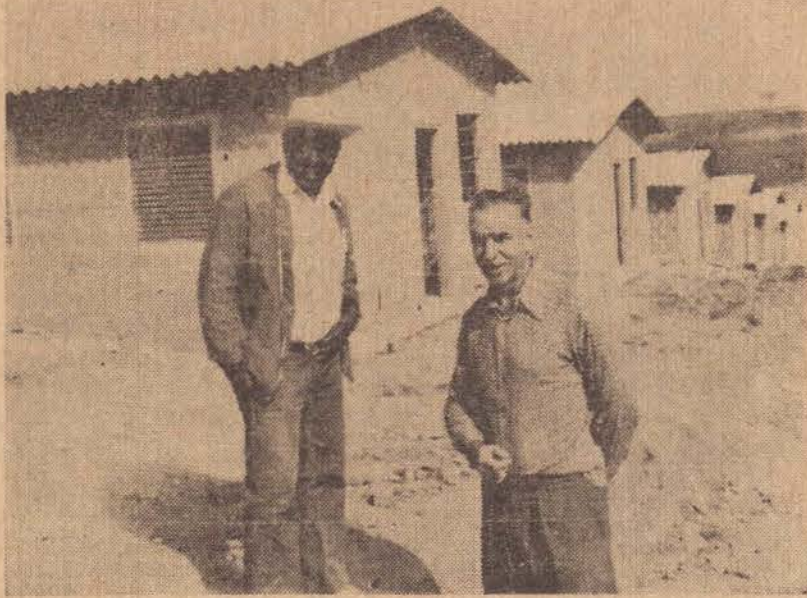
O prefeito visitando as casas do Parque Cedral.