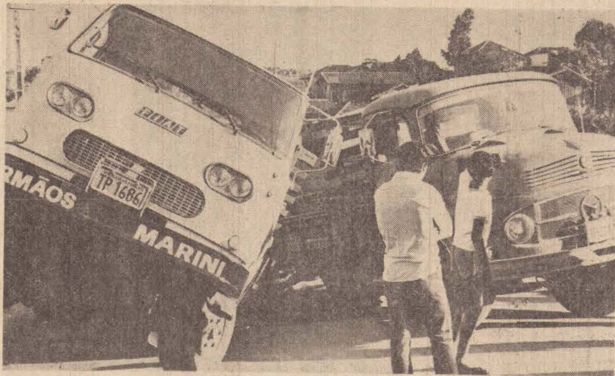
Foi preciso o guincho para retirar os veículos.