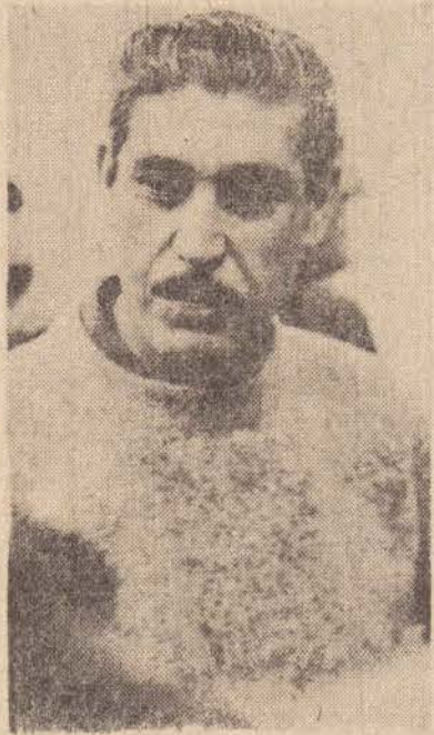
Após a partida com o Juventus o técnico Osvaldo Brandão resolveu deixar o cargo.

E chegou dizendo que passou a tarde toda com Osvaldo Brandão, tentando fazer o treinador voltar atrás na decisão de sair e ficar pelo menos até o final do torneio seletivo. O que pesou na decisão do velho treinador foi a reação após o empate de ontem (3 a 3) com o Juventus. Ele não ficou preocupado com as vaias