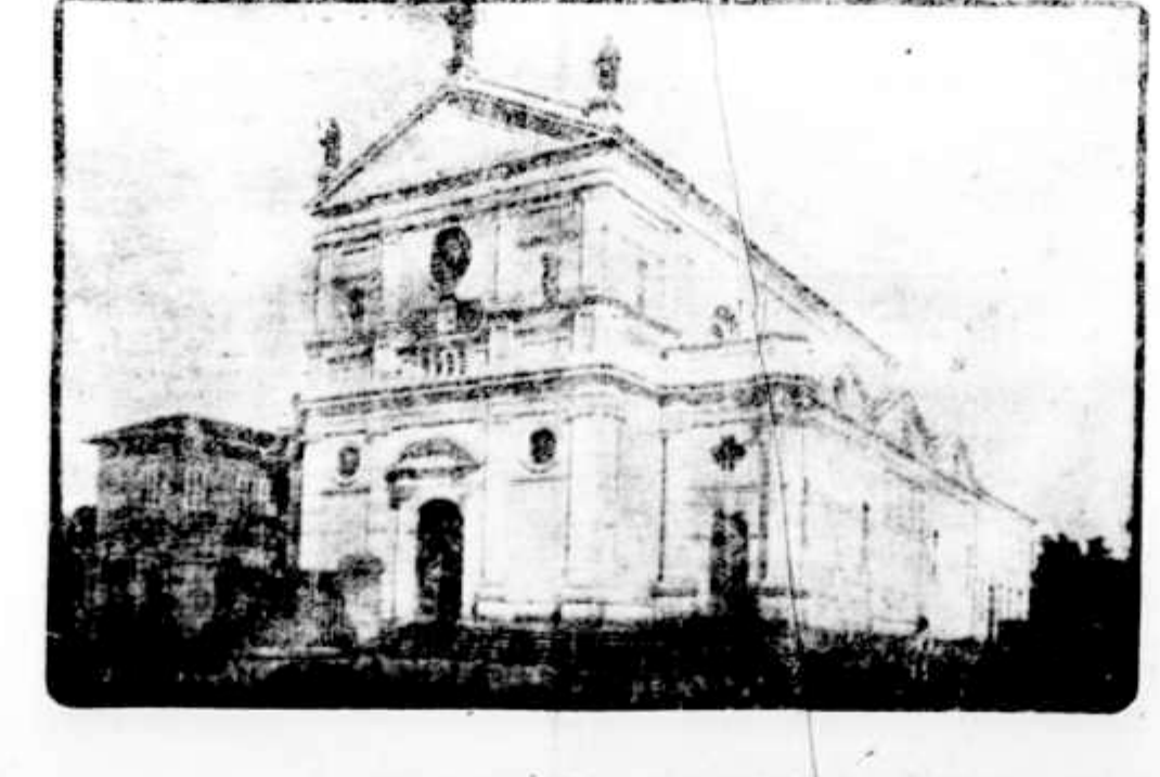
REBEJA MATRIZ DE PIRACICABA

RECIFE, 30 - O chefe de policia abandonou a terra que nos viu noscer,