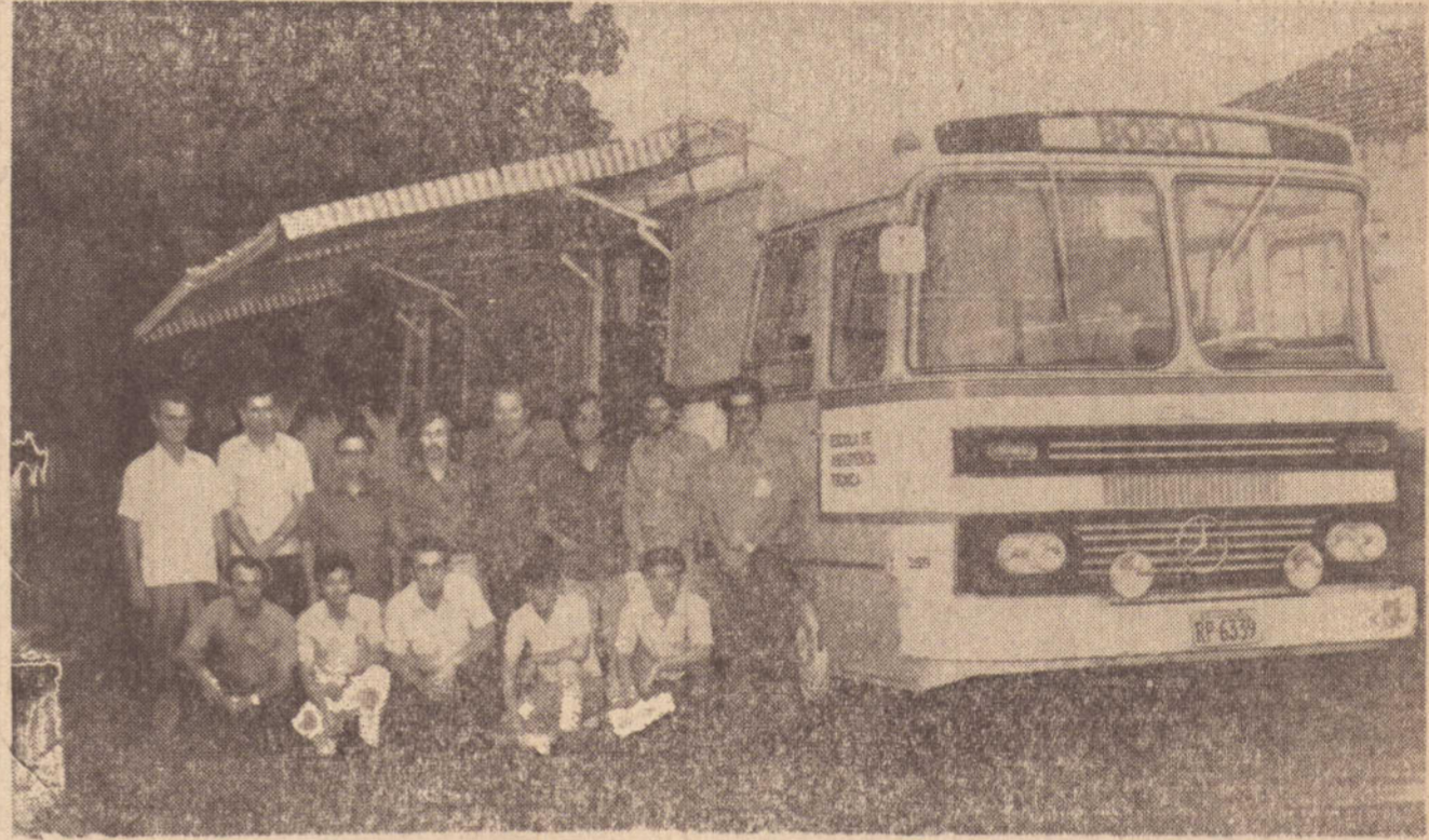
Esta é a Escola de Assistência Técnica Volante da BOSCH, que está em Pres. Prudente desde ontem, ministrando cursos sob o patrocínio da RADIPEL, de Nogueira, Fioresi & Cia. Ltda.

O Ônibus-Escola encontra-se estacionado ao local da RADIPEL — Rede Distribuidora de Pe-