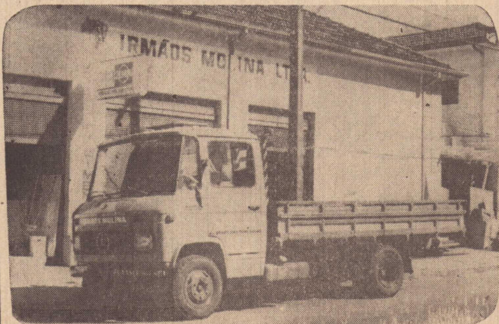
L-608D (MERCEDINHO) — MAIS UM PRODUTO DA Mercedes — Benz do Brasil S.A