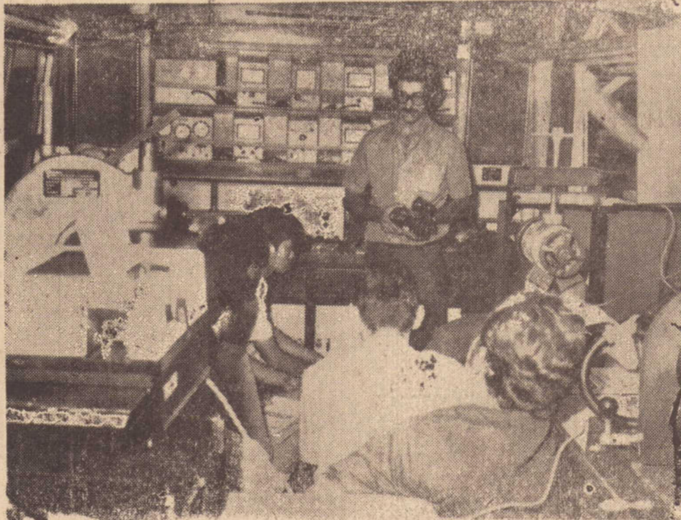
Aqui, os alunos aprendem tudo sobre equipamentos elétricos. A foto foi colhida no interior do Ônibus Escola

"As nossas autoridades e a população machadense as nossas manifestações de regosio pela efemeridade do município."