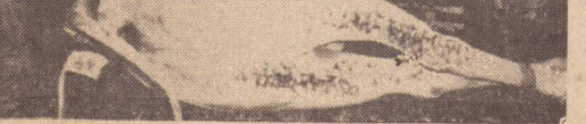
Bois assustaram a cidade na noite de sábado

Na esquina da Rui Barbosa com Avenida Brasil o único remédio para conter a fúria de um boi nervoso e perdido, foi amarrá-lo a um poste de energia, da Caiuá.