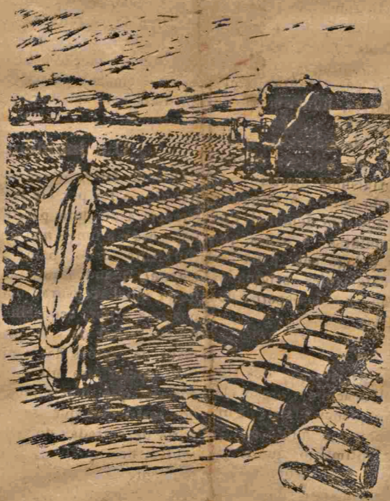
Más os instrumentos de destruição recebem a benção dos padres de todas as religiões.