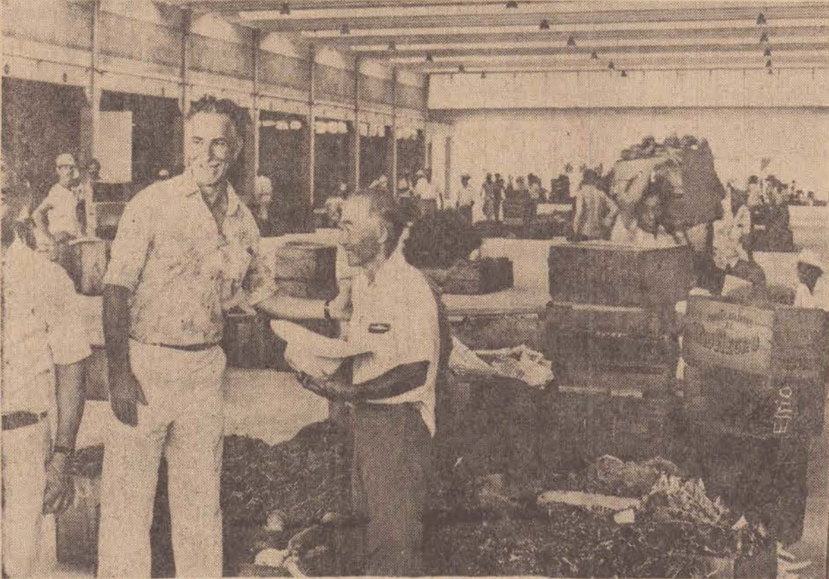
O prefeito foi acompanhar e voltou satisfeito.