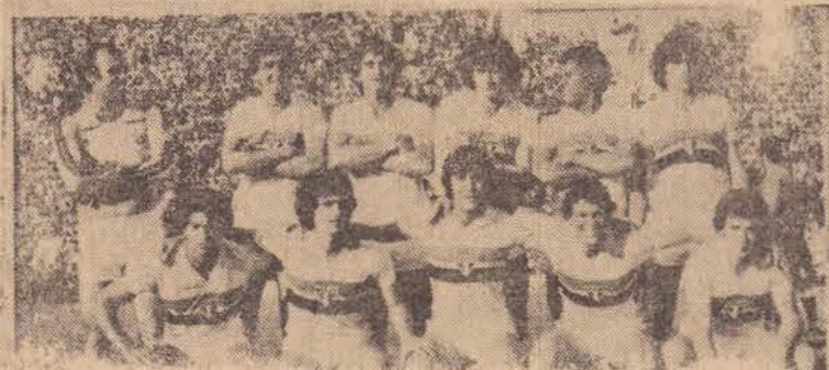
O São Paulo reuniu meritos totais na conquista do bi-campeonato, numa demonstração de um trabalho que alcançou o seu objetivo.