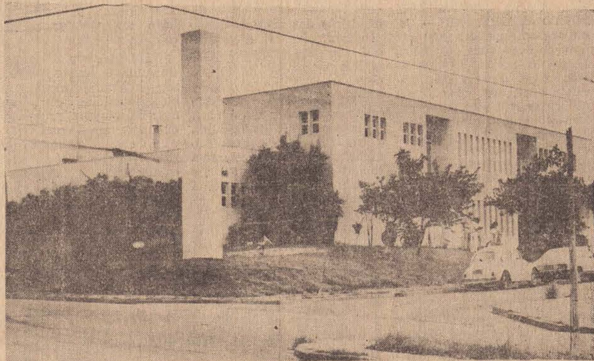
O moderno hospital Nossa Senhora de Fátima, agora credenciado pela Previdência Social.