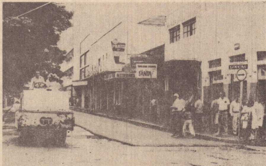
O rolo compressor, já está nas obras de recapeamento da Maffei, desde ontem. Hoje passará para a Barão.

O período de atendimento é das 8 às 16 horas, podendo ser vacinadas pessoas a partir de um (1) ano de idade imunizando por cinco (5) anos.