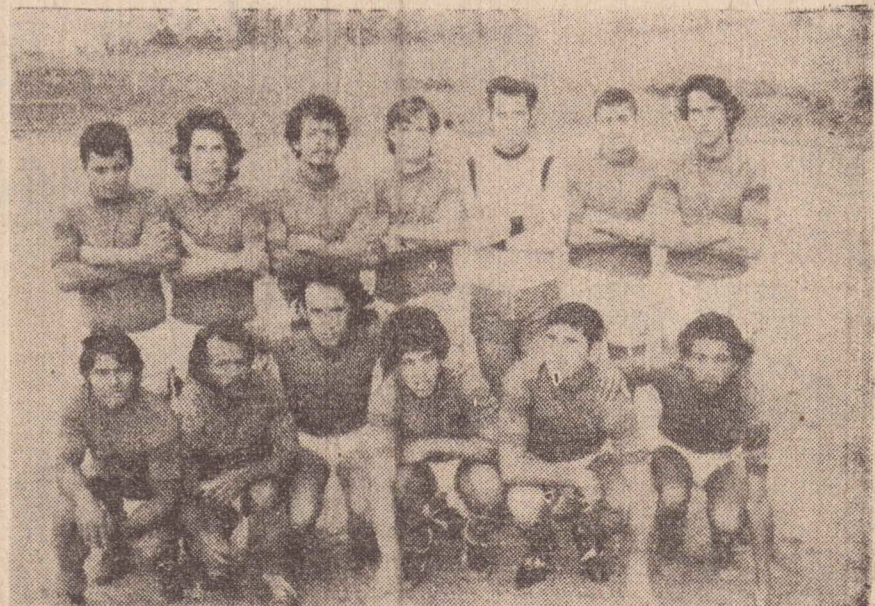
O time perdedor: Vila Brasil.