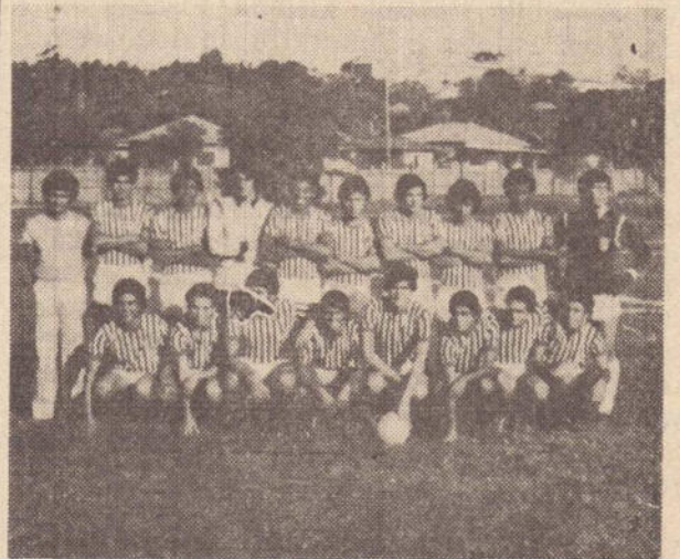
SELEÇÃO GANHA FACIL

Após a realização da segunda rodada do primeiro turno, eis a classificação do Campeonato Dente de Leite da temporada 77. Pontos ganhos 1.º) — Paulista FC 3 2.º) — São Paulo FC, GE Alfredo Marcondes e P. Prudente FC 2 3.º) — EC Corinthians de P. Prudente, Apec e GE Guarda Mirim 1 Pontos perdidos 1.º) — Pres. Prudente EC 0 2.º) — Paulista FC e Apec 1 3.º) — São Paulo FC e GE Alfredo Marcondes 2 4.º) — EC Corinthians de Pres. Prudente e GE Guarda Mirim 3 Proxima rodada Apec x EC Corinthians de P. Prudente Paulista FC x São Paulo FC GE Alfredo Marcondes x Pres. Prudente FC