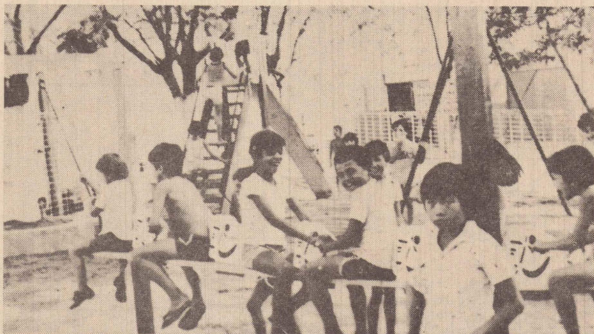
As crianças da Vila Industrial já tem onde passar suas horas de lazer.