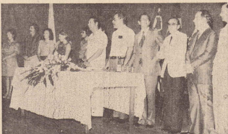
A mesa de honra que procedeu a entrega dos certificados.

Disse o prefeito que é emocionante observar a demonstração de otimismo daqueles que hoje recebem a luz do saber através do MOBRAL. A força de vontade e o desejo de vencer são qualidades que se estampam no semblante de cada um dos novos formandos.