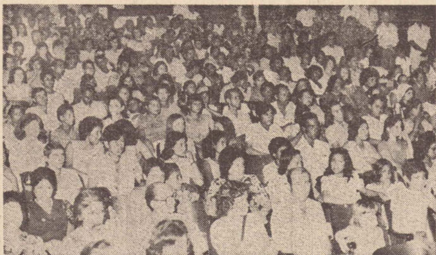
A cada dia, uma nova legião de brasileiros alfabetizados