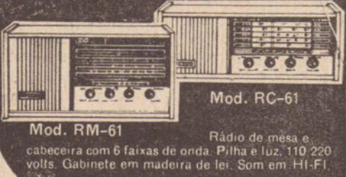
Mod. RM-61 Rádio de mesa e cabeceira com 6 faixas de onda. Pilha e luz, 110/220 volts. Gabinete em madeira de lei. Som em HI-FI. Mod. RC-61 Rádio de mesa e cabeceira com 6 faixas de onda. Pilha e luz, 110/220 volts. Gabinete em madeira de lei. Som em HI-FI.