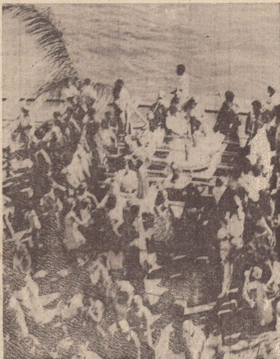
Centenas de pessoas humildes lutam para que a festa do "Dia dos Navegantes" ganhe nova vida.

Segundo informações, a direção da indústria, tomará todas as providências para evitar a poluição