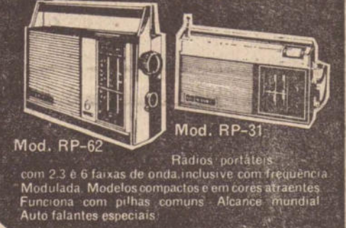
Mod. RP-62 Rádios portáteis com 2,3 e 6 faixas de onda, inclusive com frequência Modulada. Modelos compactos e em cores atraentes. Funciona com pilhas comuns. Alcance mundial. Auto falantes especiais. Mod. RP-31 Rádios portáteis com 2,3 e 6 faixas de onda, inclusive com frequência Modulada. Modelos compactos e em cores atraentes. Funciona com pilhas comuns. Alcance mundial. Auto falantes especiais.