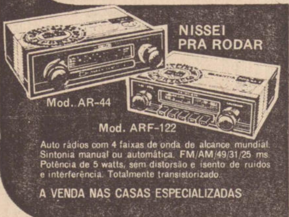
Mod. AR-44 Auto rádios com 4 faixas de onda de alcance mundial. Sintonia manual ou automática. FM/AM/49/31/25 ms. Potência de 5 watts, sem distorção e isento de ruídos e interferência. Totalmente transistorizado. Mod. ARF-122 Auto rádios com 4 faixas de onda de alcance mundial. Sintonia manual ou automática. FM/AM/49/31/25 ms. Potência de 5 watts, sem distorção e isento de ruídos e interferência. Totalmente transistorizado.