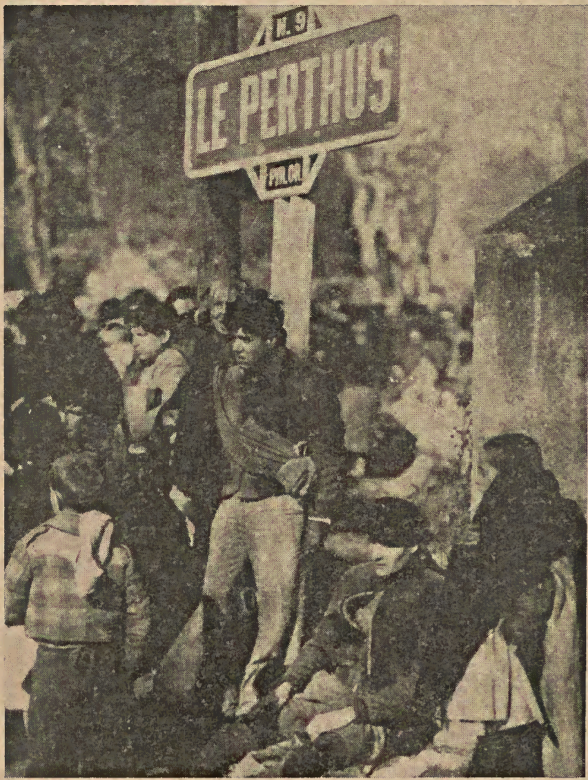
Todos los ingredientes de la gran tragedia de febrero de 1939 se hallan representados en esta instantánea macabra y principalmente en los rostros de los personajes: el soldado, la madre con el hijo en brazos, el niño adolescente, el herido con sus muñones y el rótulo de la frontera del exilio. Las miradas, absortas y doloridas miran hacia la España en ruinas que bajo las botas castrenses ha quedado atrás.