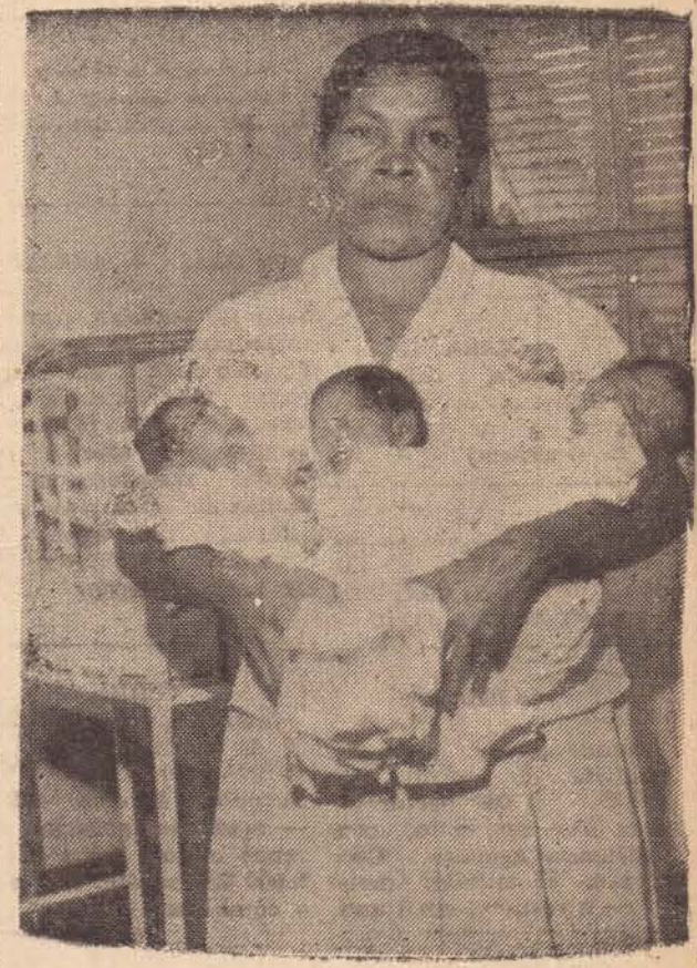
"MOÇO! QUANDO E' QUE VAI COMEÇA' O TAL DE CONTROLE DE NATALIDADE, HEIN?"

— Não quero lá saber disso! Vá buscar um!