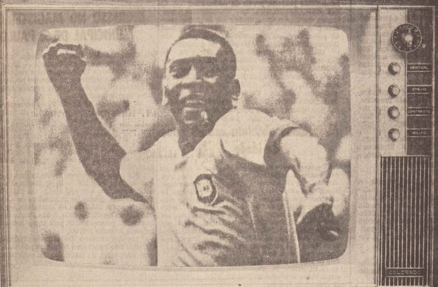
Mod. CO 7 de 24"