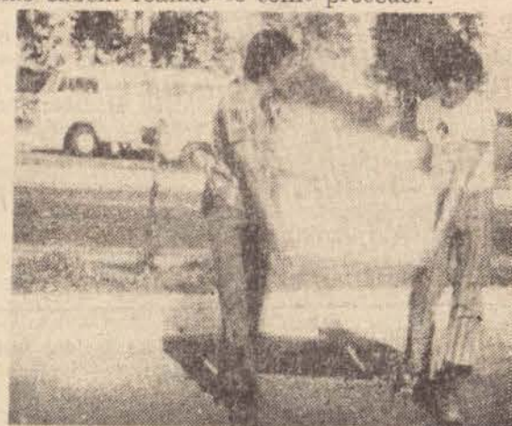
Os fiscais têm vontade de trabalhar, mas não precisam ser arbitrários.

Pela portaria 466 da Sudepe é permitido o uso de redes e espinheis para pescadores profissionais, menos na placema. O mesmo sucede no Estado de São Paulo. Já em Mato Grosso do Sul esses apetrechos são proibidos. Em ambos os Estados é proibido o uso de físgas e galateias. Enquanto em São Paulo não há restrições ao transporte de peixes sem cabeças em Mato Grosso é proibido. As proibições e permissões em ambos os Estados são conflitantes e os pescadores, profissionais ou amadores não sabem realmente como proceder.