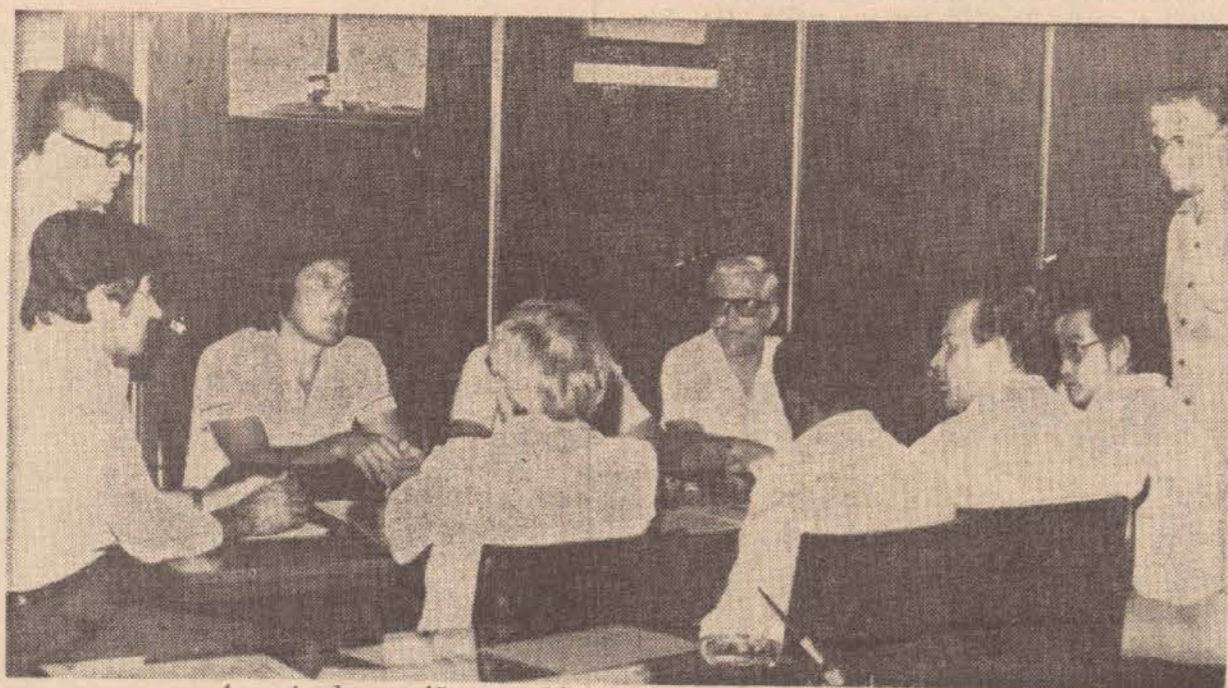
Aspecto da reunião no gabinete do prefeito municipal.