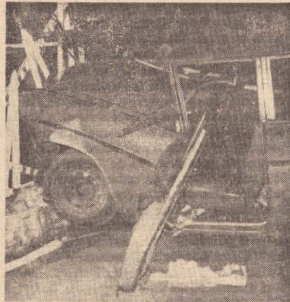
O veículo ficou seriamente avariado e seus ocupantes feridos.