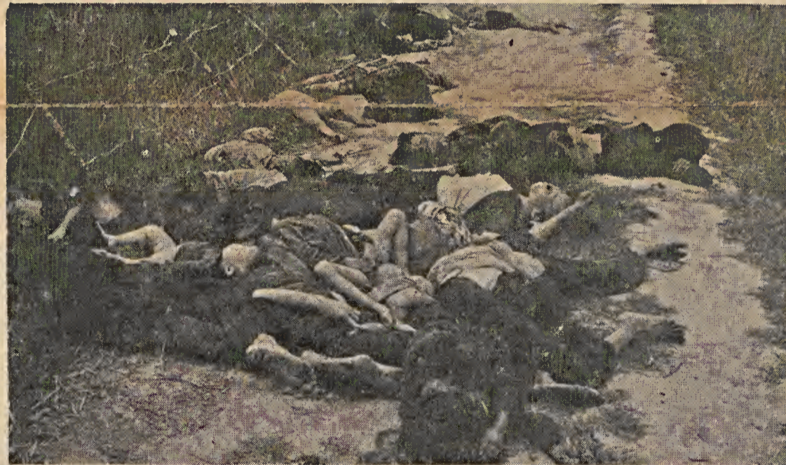
... los "beneficiarios" de las zonas de influencia...

Precediendo a Lamarck y a Darwin, señaló Bacon que bajo la influencia de las condiciones exteriores, siempre cambiantes, nacen nuevas especies de plantas y animales; en cuanto a Descartes puede decirse que con su teoría a torbellinos supo ya prever los descubrimientos científicos de el siglo XIX.