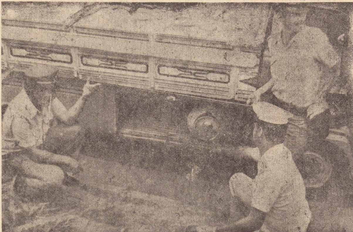
Apesar de obter maior economia, a Kombi não pode usar o gás.