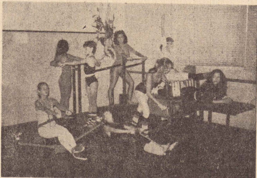
● O Studium 1 continua a todo vapor com aulas de ballet clássico "baby-classe e pré-class", ginástica, jazz, dança moderna, yoga e capoeira. Na foto, uma das aulas de ginástica nos apa-

O garimpo de Santa Rosa — prossegue a denúncia — está servindo de trampolim para que os garimpeiros atinjam áreas ainda não exploradas nos rios Uraricá e Uraricoera, daí a urgência da abertura de um posto de fiscalização no encontro dos Rios Erico com Coimin para controlar a entrada de estranhos na área norte do parque.